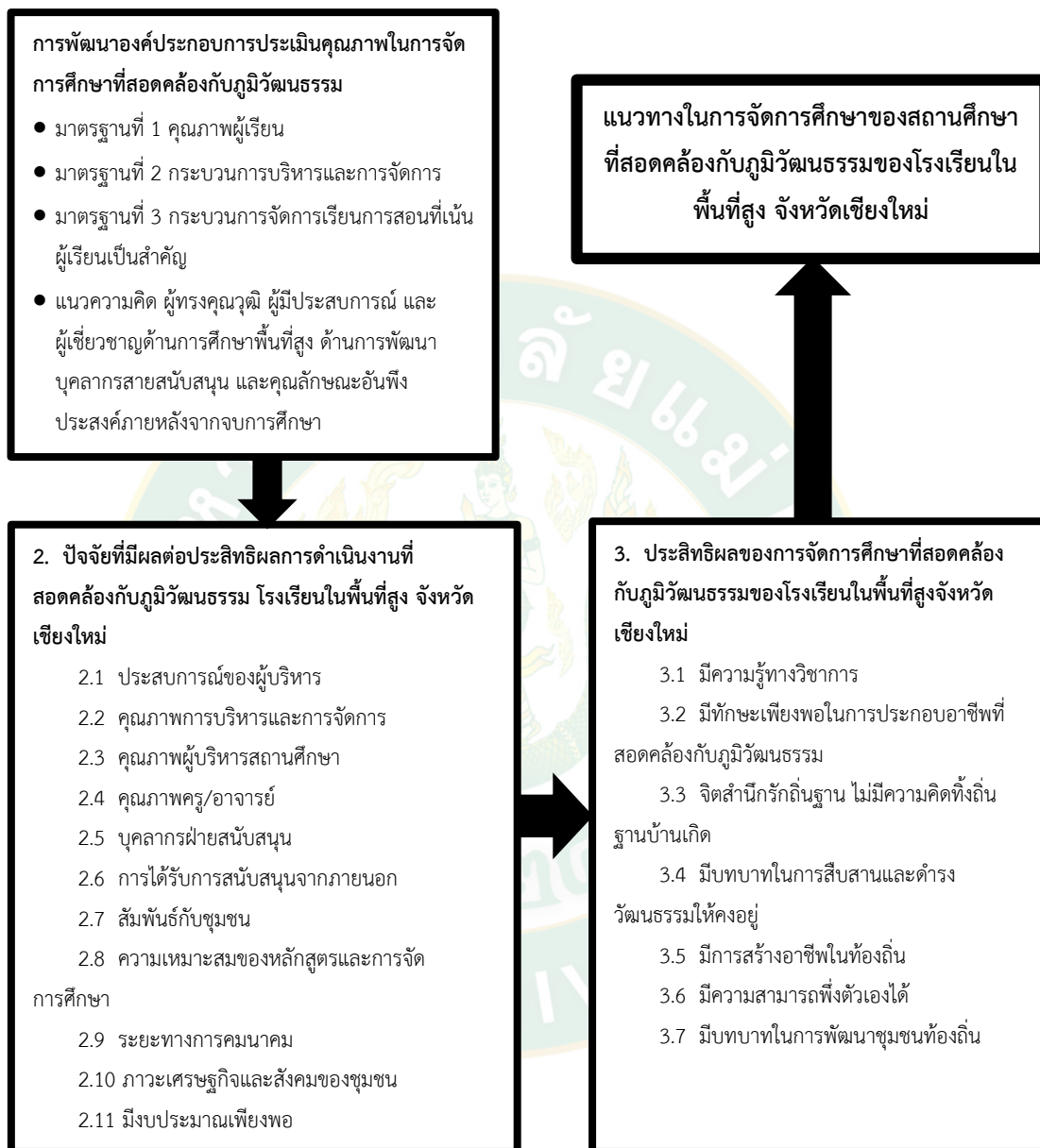
ภาพที่ 1 กรอบแนวคิดในการวิจัย