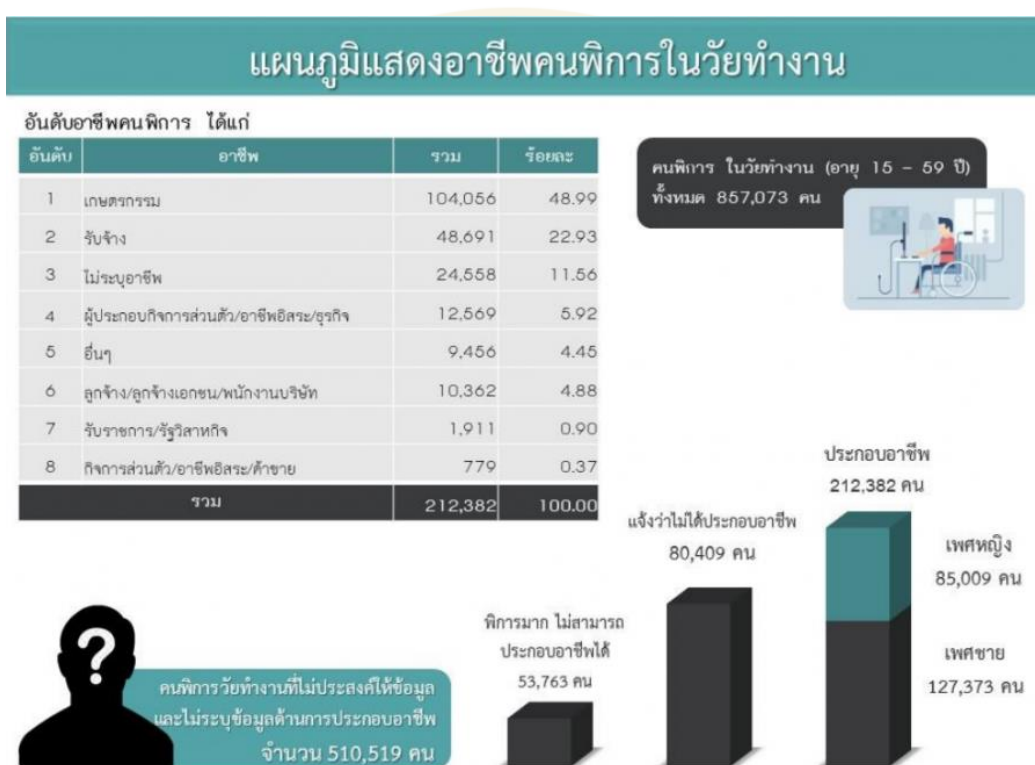
ภาพที่ 2 แผนภูมิแสดงอาชีพคนพิการในวัยทำงาน