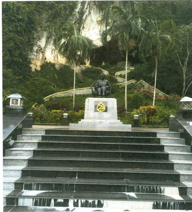
ทัศนียภาพภายในสวนสมเด็จพระศรีนครินทร์ฯ