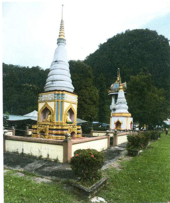
ทัศนียภาพภายในวัดราชบูรณะ