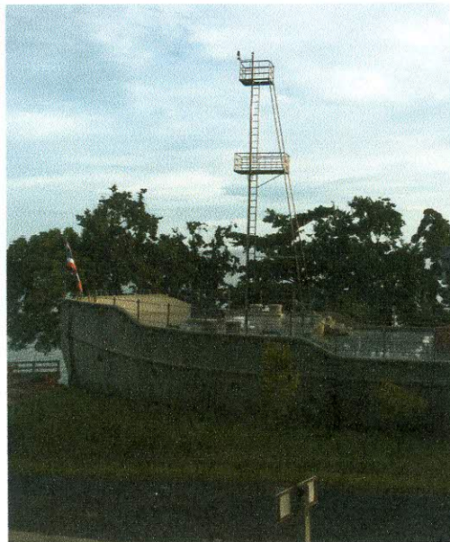
ทัศนียภาพภายในวัดคอเขา