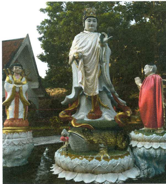
ทัศนียภาพภายในวัดคอเขา