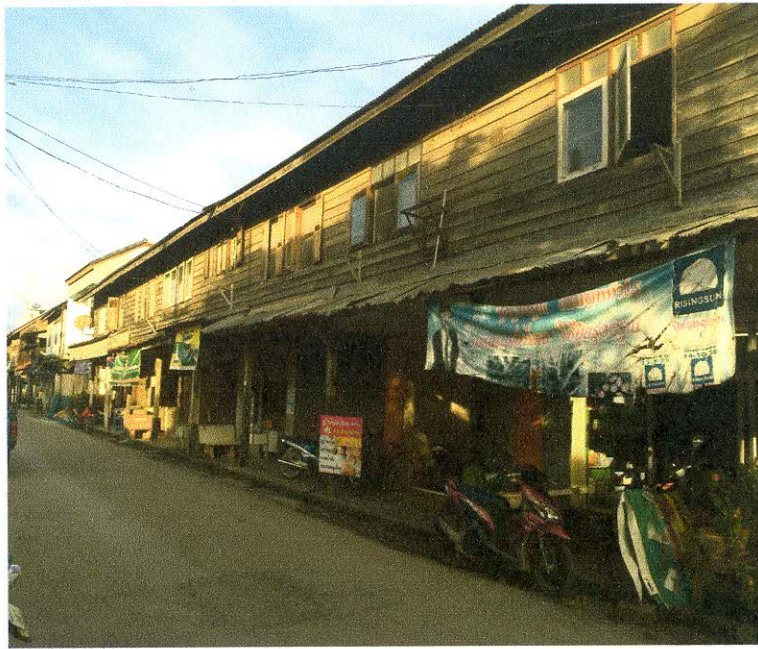
ทัศนียภาพภายในชุมชนดั้งเดิมอำเภอหลังสวน