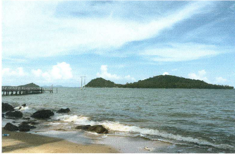
ทัศนียภาพภายในชุมชนเกาะพิทักษ์