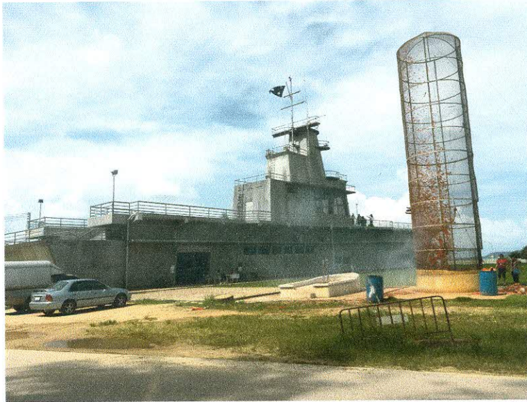
ทัศนียภาพภายในชายหาดปากน้ำหลังสวน