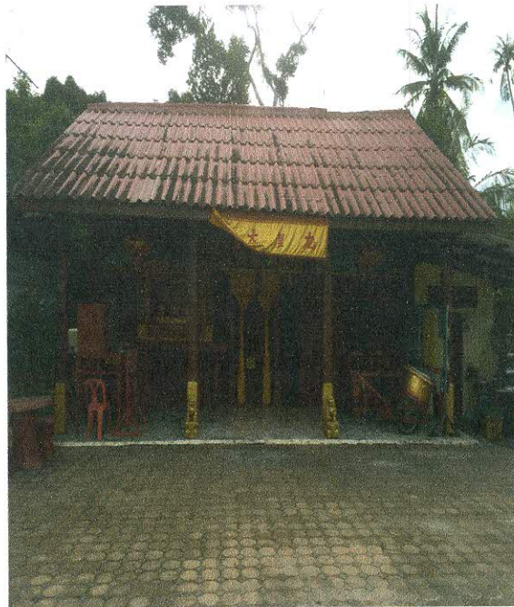
ทัศนียภาพภายในศาลเจ้าบางยี่โร