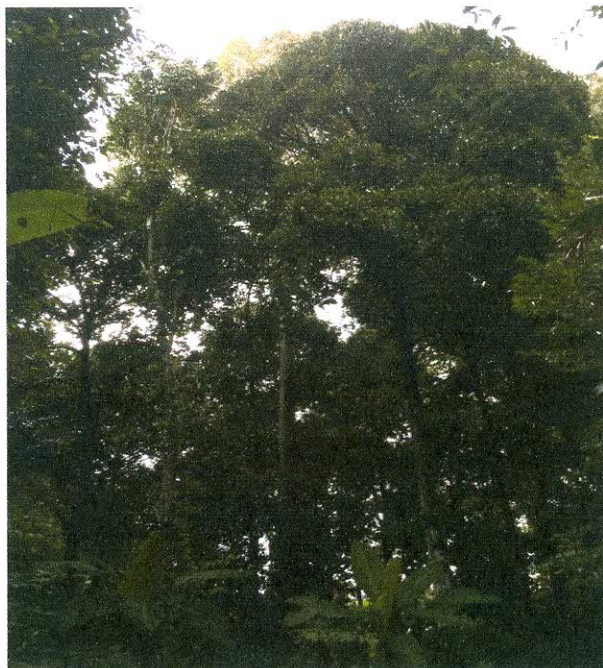
ทัศนียภาพภายในสวนผลไม้ 200 ปี