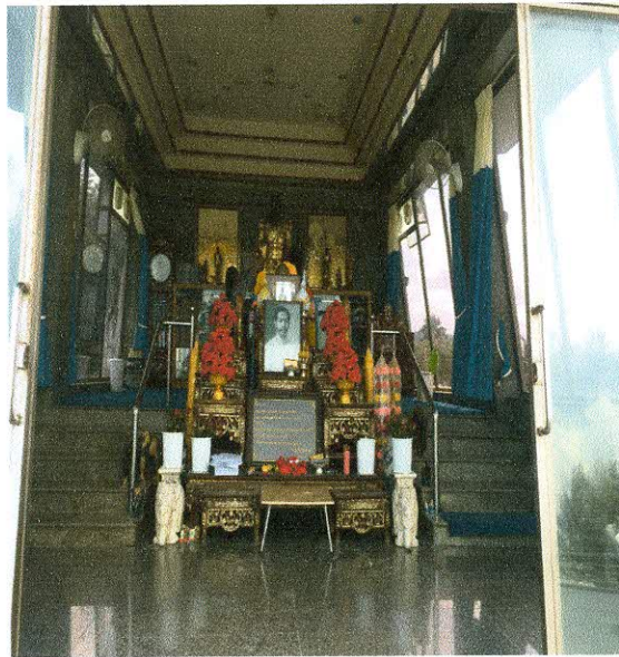
ทัศนียภาพภายในชายหาดปากน้ำหลังสวน