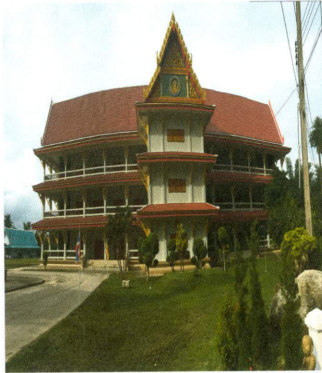
ทัศนียภาพภายในวัดราชบูรณะ