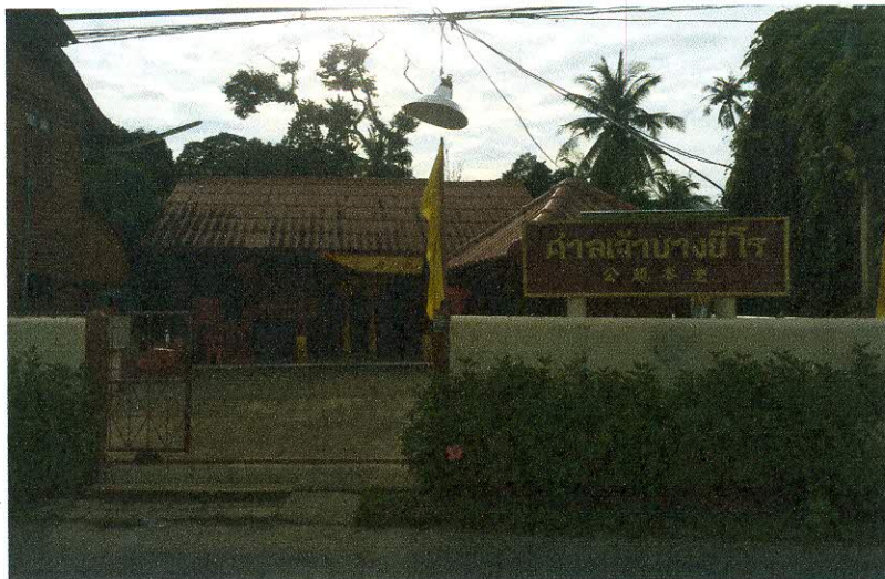
ทัศนียภาพภายในศาลเจ้าบางยี่โร