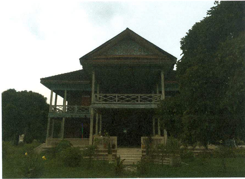
ทัศนียภาพภายในวัด โตนด