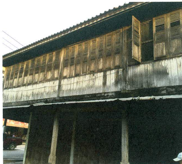
ทัศนียภาพภายในชุมชนดั้งเดิมอำเภอหลังสวน