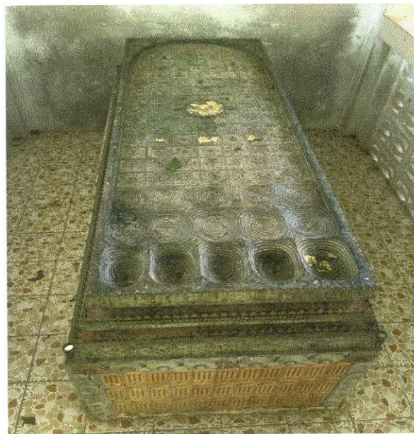
ทัศนียภาพภายในสวนสมเด็จพระศรีนครินทร์ฯ