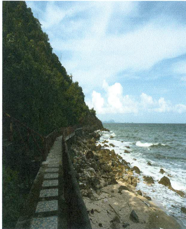
ทัศนียภาพภายในชุมชนเกาะพิทักษ์