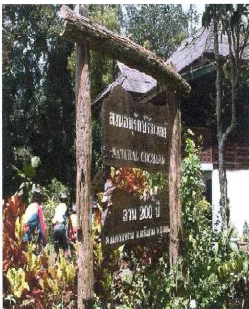
ทัศนียภาพภายในสวนผลไม้ 200 ปี