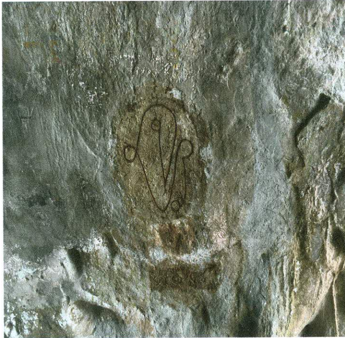
ทัศนียภาพภายในถ้ำเขาเงิน