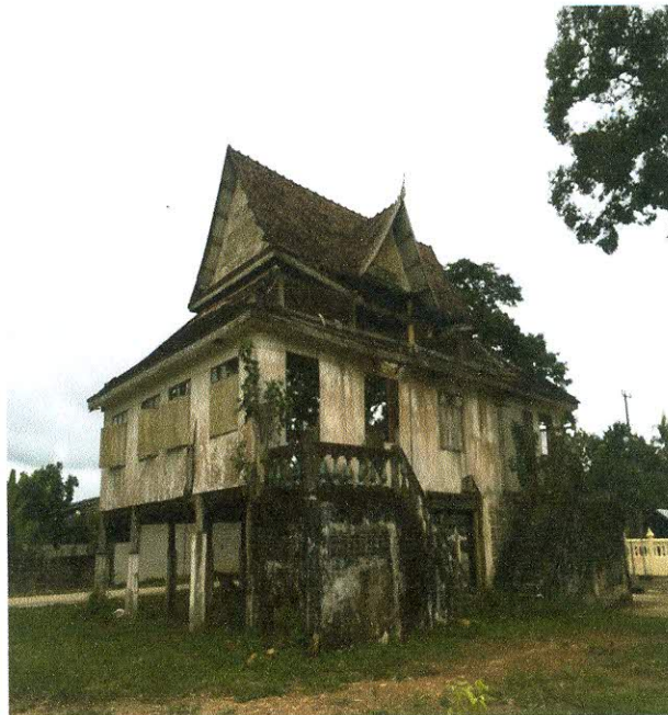
ทัศนียภาพภายในวัด โตนด