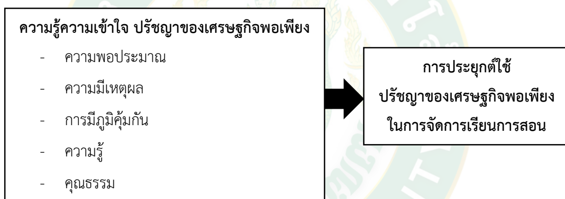
ภาพที่ 1 กรอบแนวคิดในการวิจัย

การวิจัยครั้งนี้ ผู้วิจัยมุ่งที่จะการนำปรัชญาของเศรษฐกิจพอเพียงของครูไปประยุกต์ใช้ในการจัดการเรียนการสอนในโรงเรียนอ้อมกอดวิทยาคม อ่าเภออ้อมกอด จังหวัดเชียงใหม่ สังกัดสำนักงานเขตพื้นที่การศึกษามัธยมศึกษา เขต 34