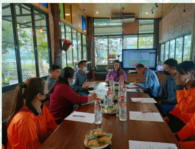
ภาพผนวกที่ 2 การสัมภาษณ์ข้อมูลเรื่องการประยุกต์ใช้ปรัชญาของเศรษฐกิจพอเพียง กับธุรกิจก่อสร้าง ห้างหุ้นส่วนจำกัดทีเอ็นคอนสตรัคชั่นเชียงใหม่