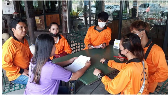
ภาพผนวกที่ 3 การสัมภาษณ์แสดงความคิดเห็นของพนักงานของห้างหุ้นส่วนจำกัด ทีเอ็นคอนสตรัคชั่นเชียงใหม่