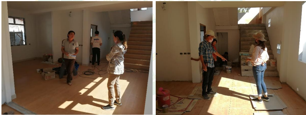
ภาพผนวกที่ 4 การสังเกตการดำเนินงานของพนักงานของห้างหุ้นส่วนจำกัด ทีเอ็นคอนสตรัคชั่นเชียงใหม่