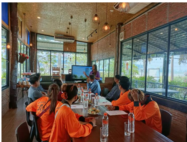
ภาพผนวกที่ 1 การชี้แจงวัตถุประสงค์ของงานวิจัยในการทำสนทนากลุ่ม