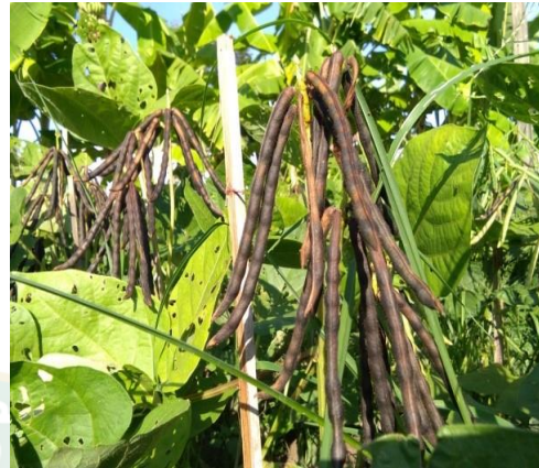
ข.ความสม่ำเสมอของการสุกแก่