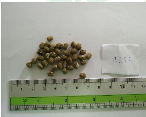
ค.ลักษณะเมล็ดสีเขียวด้าน