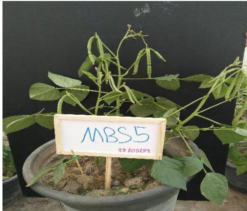
ก.ลักษณะทรงต้น