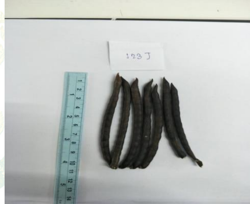
ง.ขนาดของฝัก