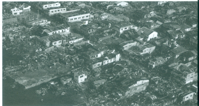
ภาพที่ 4 ความเสียหายจากพายุไต้ฝุ่นไห่เยี่ยน