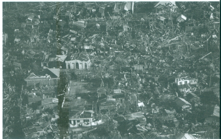
ภาพที่ 3 ความเสียหายจากพายุไต้ฝุ่นไห่เยี่ยน

สำหรับไซโคลนนาร์กีสเกิดขึ้นระหว่างวันที่ 27 เมษายน ถึง 7 พฤษภาคม พ.ศ. 2551 ขึ้นฝั่งประเทศสหภาพพม่าในพื้นที่เขตอิรวดี เมื่อวันที่ 2 พฤษภาคม พ.ศ. 2551 และ