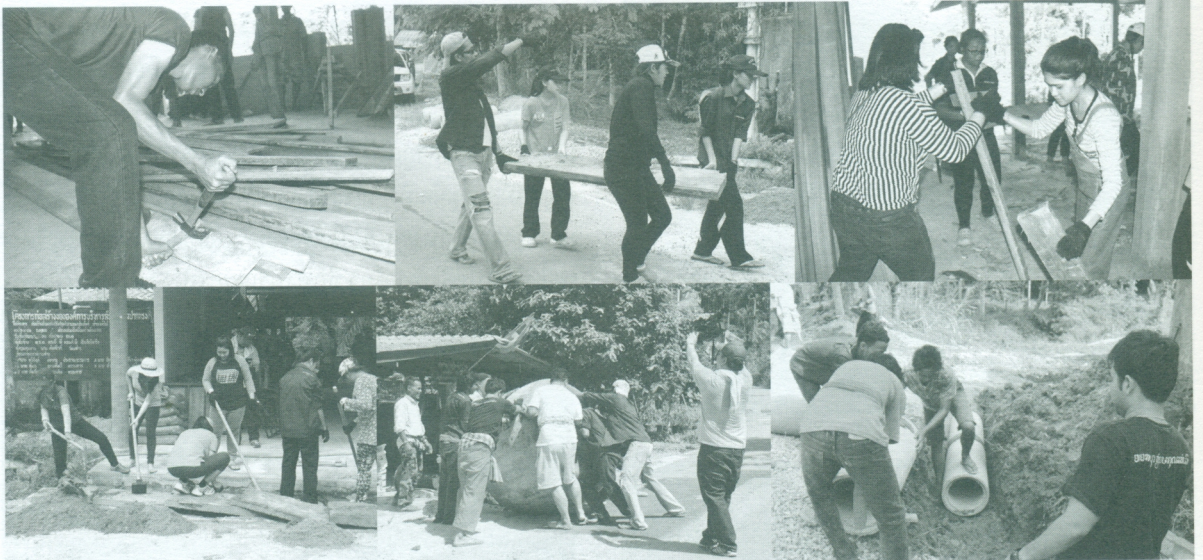
ภาพขณะปฏิบัติการกิจ