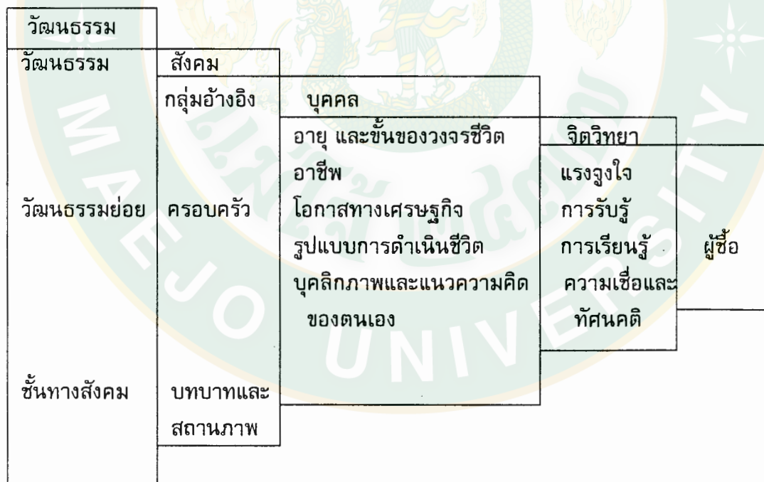
ภาพที่ 1 ปัจจัยที่มีอิทธิพลต่อพฤติกรรมผู้บริโภค

Kotler (1994: 174-190) ได้กล่าวถึงรายละเอียดของปัจจัยที่มีอิทธิพลต่อ พฤติกรรมผู้บริโภค ซึ่งมีผลต่อการตัดสินใจเลือกซื้อสินค้าหรือบริการ ดังนี้