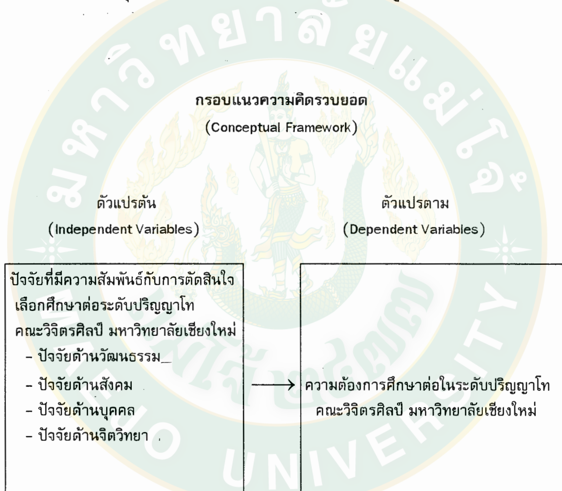
ภาพที่ 2 กรอบแนวความคิดรวบยอดในการวิจัย

การวิจัยเรื่อง ความต้องการศึกษาต่อในระดับปริญญาโท คณะวิจิตรศิลป์ มหาวิทยาลัยเชียงใหม่ มีกรอบแนวความคิดในการศึกษาถึงปัจจัยที่มีความสัมพันธ์กับการตัดสินใจเข้าศึกษาต่อในระดับปริญญาโท คณะวิจิตรศิลป์ มหาวิทยาลัยเชียงใหม่ เพื่อใช้เป็นแนวทางประกอบการวางแผนทั้งระยะสั้นและระยะยาว ในการจัดการเรียนการสอนในระดับบัณฑิตศึกษา ให้บรรลุเป้าหมายและสอดคล้องกับความต้องการของผู้เรียนและตลาดแรงงาน