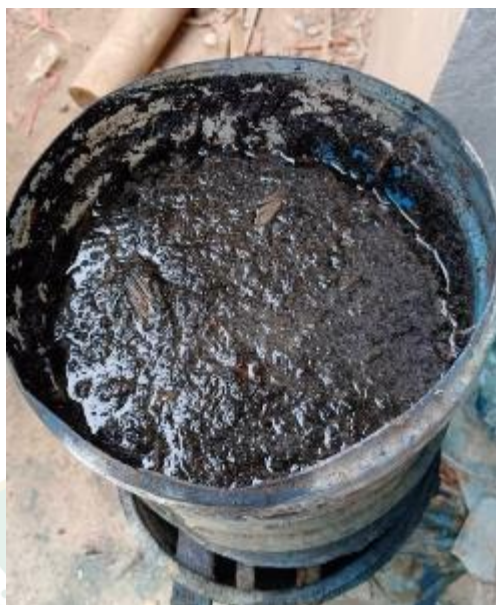
การก่หม้อครามเตรียมน้ำย้อม