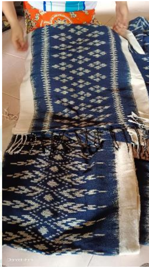
ผ้าครามที่ได้