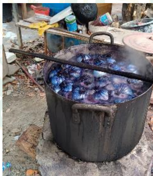
นำผ้าไปต้มแช่กับน้ำคราม