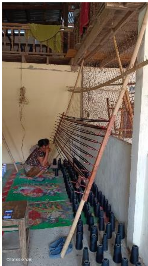
ขั้นตอนการปั่นหลอด หรือ กรอบหมี