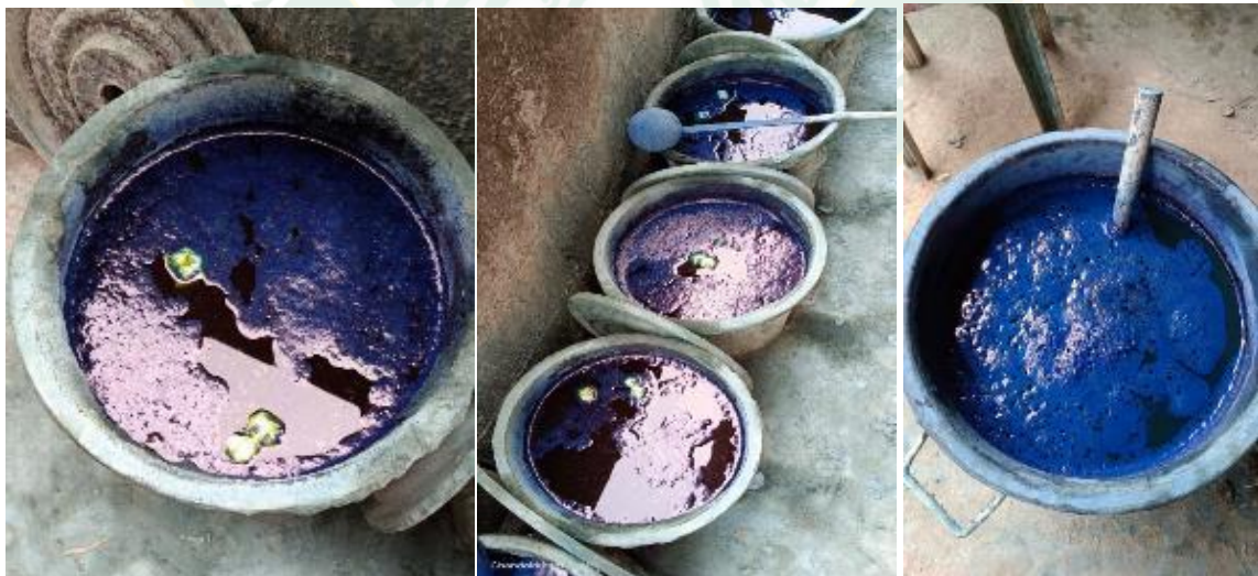
การเตรียมน้ำครามและเนื้อคราม