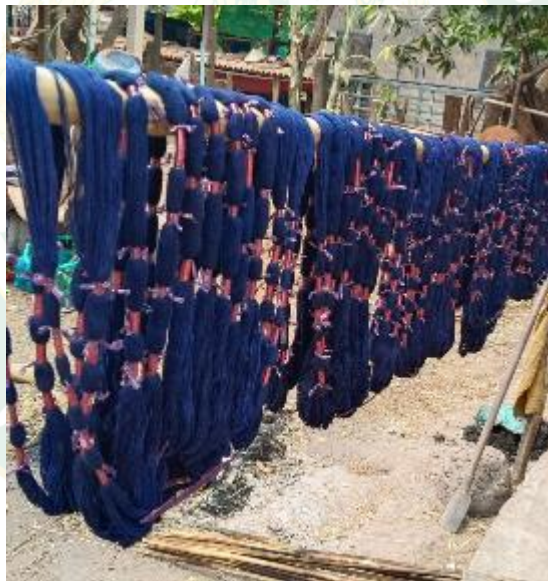
การมัดโอบหมี่