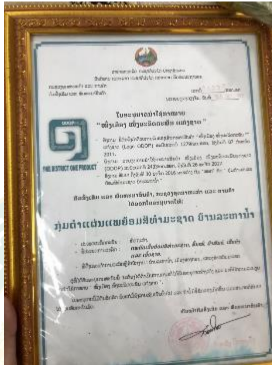
ใบอนุญาตนำใช้เครื่องหมาย ODOP ให้เป็นกลุ่มทอผ้าย้อมสีธรรมชาติ