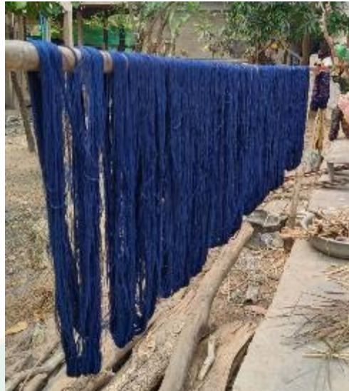
ผ้าฝ้ายที่ได้จากการย้อม