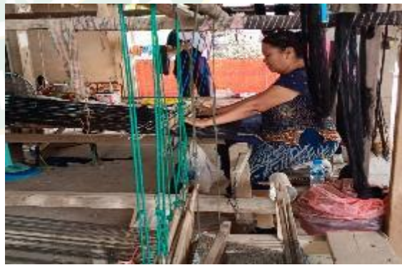
ขั้นตอนการสืบทูก