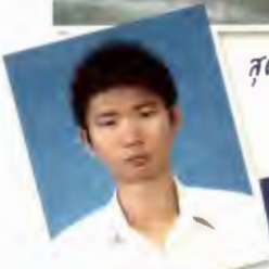
สวดออกคุณพ่อ