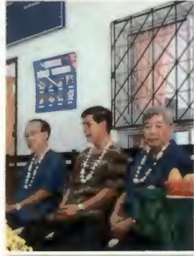
สว. พี่รพี