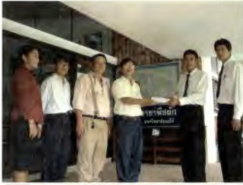
พิธีมอบทุนการศึกษา นักศึกษาสาขาพืชผัก