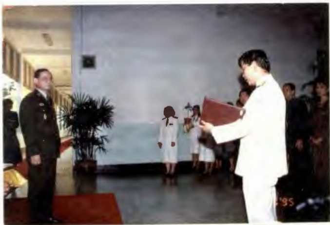
กราบบังคมทูลถวายรายงาน / เบิกตัวผู้เข้าเฝ้า