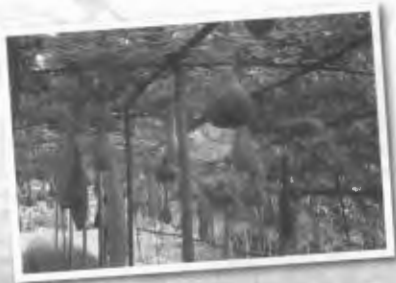
พืชรัก 27 (4 ปี)

จาก 4 ปี ที่เคยเรียนรู้นานาชาติตั้งแต่ใจแห่งนี้ และสองปีในสาขาพืชผัก ความรู้ที่ “เรา” นักศึกษา พืชผักทุกคนได้รับนั้น มาจากการทุ่มเททั้งแรงกาย และแรงใจของอาจารย์ ผู้ซึ่งเป็นที่รักและเคารพจริง ของนักศึกษาพืชผักทุกคน อาจารย์ผู้เปรียบเสมือนผู้ให้ และถ่ายทอดความรู้ให้แก่ศิษย์จนสามารถนำไป ใช้ในการประกอบอาชีพ และดำเนินชีวิตนอกรั้วมหาวิทยาลัยได้อย่างงดงาม ซึ่งร่องจันทน์ของอาจารย์จะเป็นสิ่งที่นักศึกษาทุกคนจดจำได้เสมอ เพราะทุกครั้งที่ยาจารย์อบรมสั่งสอนมักจะมีแต่ร่องจันทน์ที่แสดงถึงความเมตตาปรากฏด้วงทุกครั้ง พวกเราทุกคนจะระลึกถึง พระคุณของอาจารย์ที่ได้อบรมสั่งสอน และในคำปรึกษาแก่เราเสมอ ทังนี้ขออำนาจคุณพระศรีรัตนตรัย ชวงปกป้องคุ้มครองให้อาจารย์และครอบครัว มีสุขภาพดีและ ประสบแต่ความสุขทุกประการ