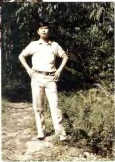
พระโศก พ.ศ. 2515