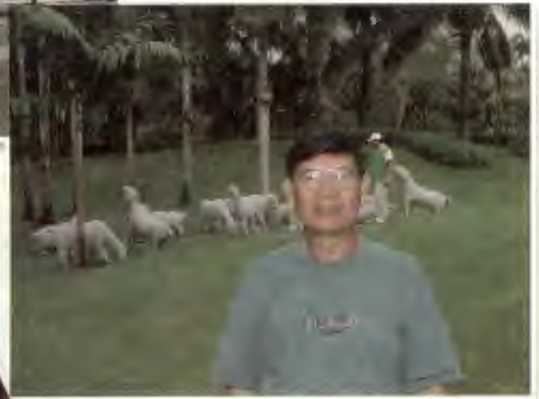
หากว่างกับการเดินทางแสวงหาความรู้ สู่ อุกติษณ์ และแม่ใจ