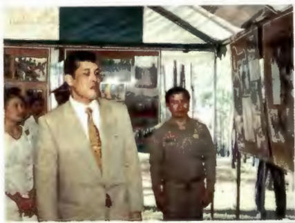
นำเสด็จฯ ทอดพระเนตร ภาพโครงการบรรพชาสามเณรฯ