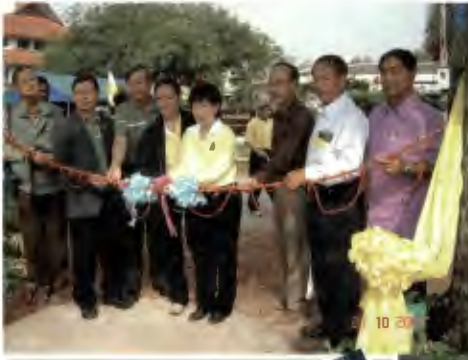
สาขาพืชผัก ครบ 30 ปี จัดแปลงสาธิตพันธุ์พืช ร่วมกับ สวทช. (biotech) และบริษัทเมล็ดพันธุ์