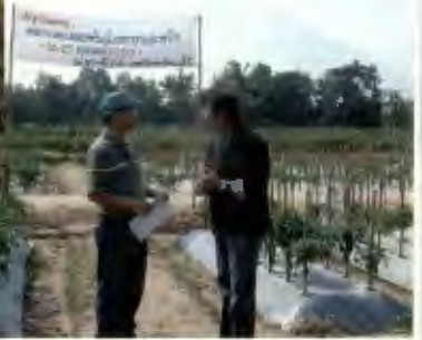
ตรวจงานแปลง