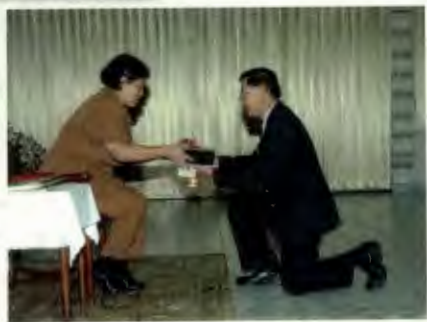
นำนักศึกษาทุนมูลนิธิฯ พัฒนาฯ ปริญญาโทหลักสูตรภูมิสังคมฯ เข้าเฝ้าฯ ถวายรายงานตัว