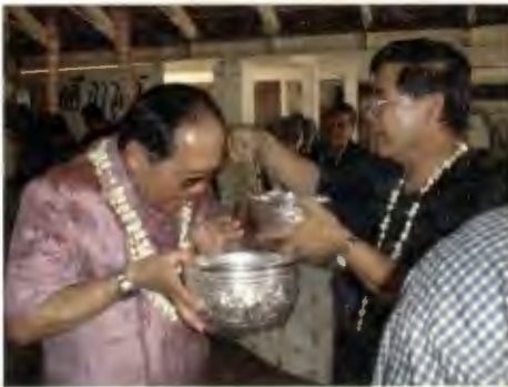
อว.รังใจดีพร ที่งาน, นักศึกษาวพี่รพี