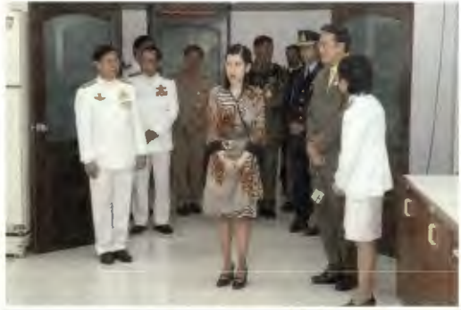
นำเสด็จ ทอดพระเนตรโครงการวิจัย และพัฒนา กัญชงไหมเชิงอุตสาหกรรมในพระตำหนัก ณ อาคาร เฉลิมพระเกียรติสมเด็จพระเทพรัตนราชสุดา