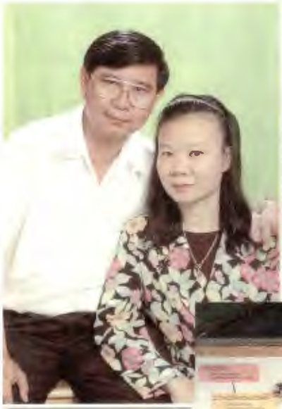
กับภรรยา