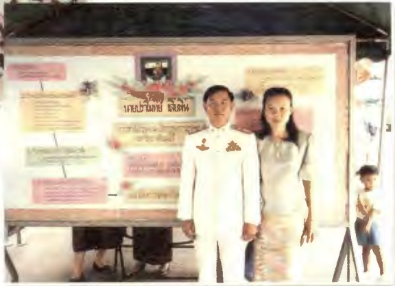
งานรับรางวัลคุณนิชิคุบาศรีวิจั