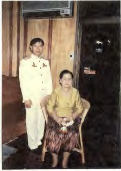
ถ่ายภาพกับคุณแม่