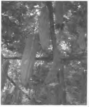
ด้วยความเคารพ นักศึกษาคณะพีรฉกปีที่ 4 (4 ปี)