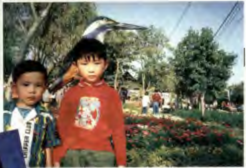
ครอบครัวอบอุ่น อาจารย์สุภาพดีแน่นอน เพราะมีคุณหมอลดูแลถึง 3 คน