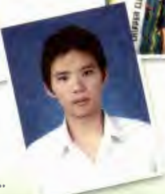
น้องหน้า