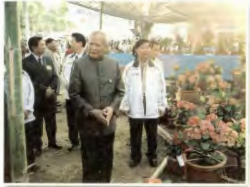
งานเกษตรแม่ใจ ๗๐ ปี