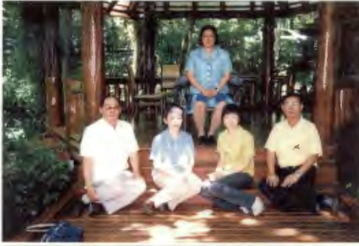
เจ้าฟ้ารับเสด็จ ที่สวนเกษตรส่วนพระองค์ ต.แม่แร่ม อ.แม่ริม