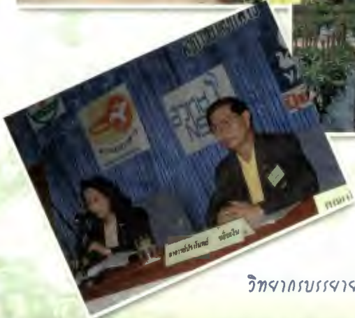
วิทยากรบรรยายวิชาการด้านพืชผัก