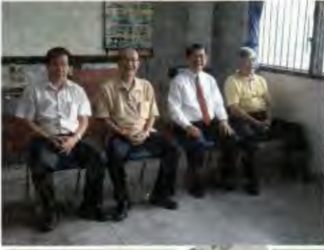
ถ่ายภาพกับหลายๆ พี่รพี