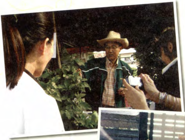
มะเขือม่วงกรอบแม่ใจ (อธิบงานี้ได้จ้างพันธุ์ฝรั่ง)