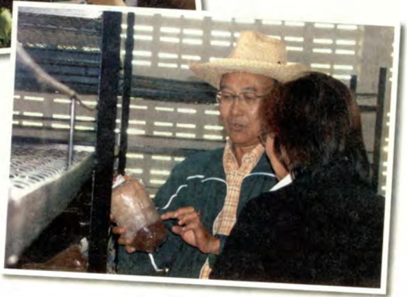
อุเส็งผิงเหน็ด