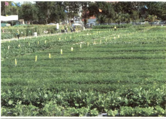
แม่โจ้ 75 ปี, 2551