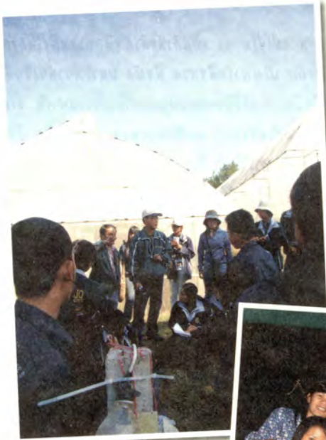
Trip แล่สำเนา