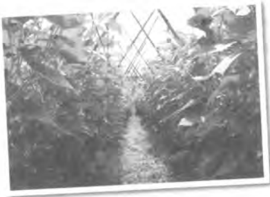
ด้วงความเคาแฟรัก สิทธิ วัลล แม่โจ้ 36 พืชผักรุ่น 1

มาถึงวันนี้อาจารย์อายุครบ 60 ปี อาจารย์จะได้พักผ่อนเ็นเวลาของตัวเอง และครอบครัวเต็มที่ ผมขอแสดงความคิดถึง เจอีนอาจารย์มาพบน้องๆ ที่สาขาพืชผักได้ตลอดเวลาคับ