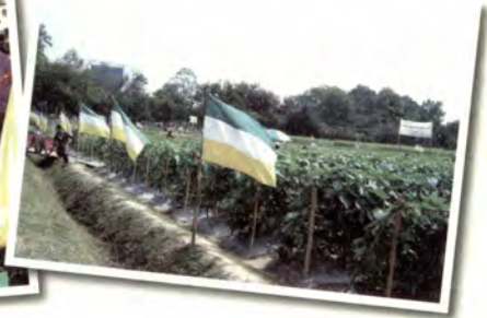
พืชผัก 30 ปี, 2550