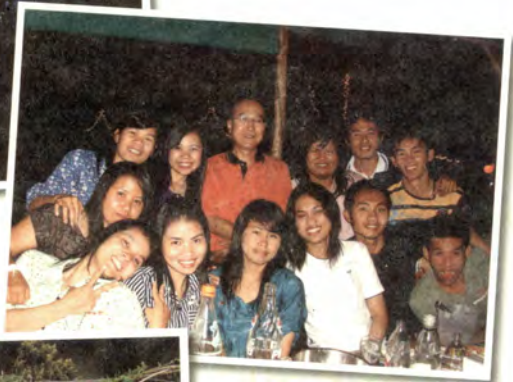
งานบางเขิน