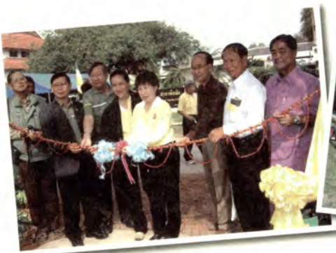
มหกรรมแสดงพันธุ์แตงกวาและพริก