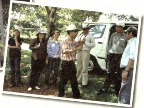
ที่โครงการพิเศษ สวนเกษตรเมืองจาง