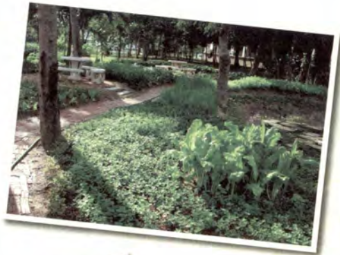
สวนผักสวย