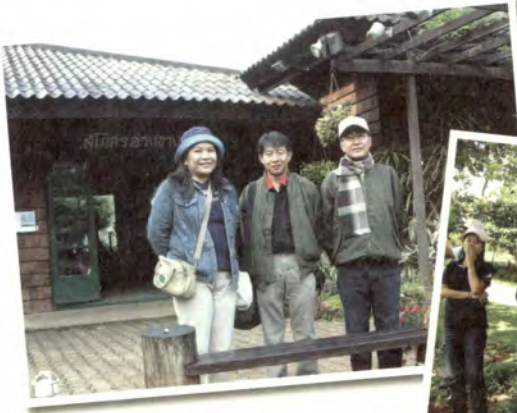
สุดงอดคนรู้ทัน