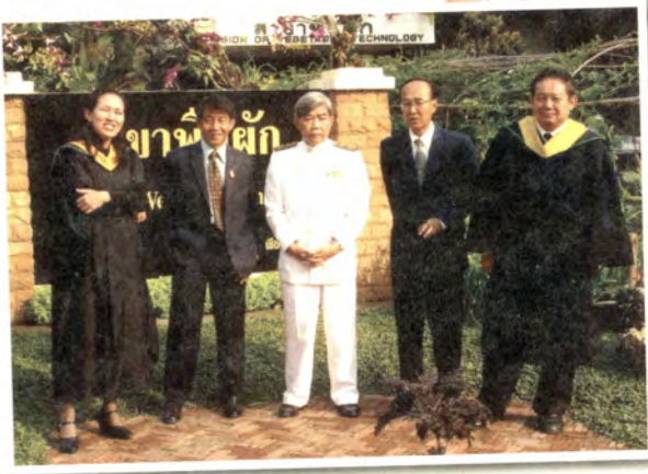
รอต่างรูปกับลูกศิษย์