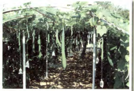
แม่โจ้ 70 ปี, 2547