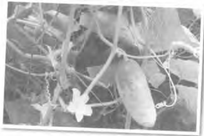
ด้วยความเคารพ จากศิษย์ปัจจุบัน พิชญ์ภรณ์ 32

สุดท้ายนี้ในโอกาสที่ท่านอาจารย์เกษียณอายุราชการในปีนี้ ขออำนาจแห่งคุณพระศรีรัตนตรัย และสิ่งศักดิ์สิทธิ์ ทั้งนาค จงดลบันดาลให้คุณอาจารย์ดำเกิงและครอบครัวจงมีความสุข มีสุขภาพที่แข็งแรงตลอดไป