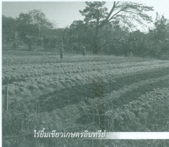
ไร่ยิ้มเขียวเกษตรอินทรีย์