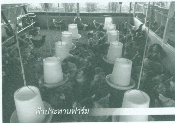
ฟ้าประทานฟาร์ม