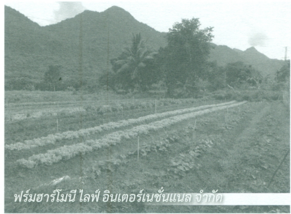
ฟาร์มฮาร์โมนี ไลฟ์ อินเตอร์เนชั่นแนล จำกัด