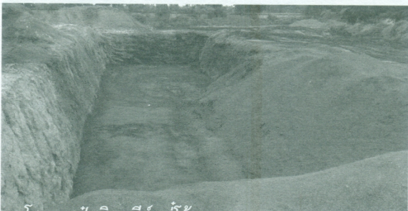
โรงงานปุ๋ยอินทรีย์แม่โจ้การเกษตร