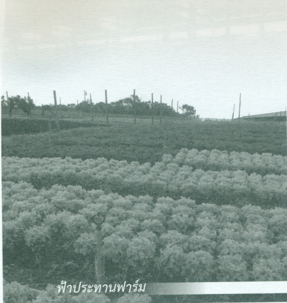
ฟ้าประทานฟาร์ม