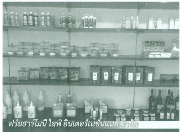
ฟาร์มฮาร์โมนี ไลฟ์ อินเตอร์เนชั่นแนล จำกัด