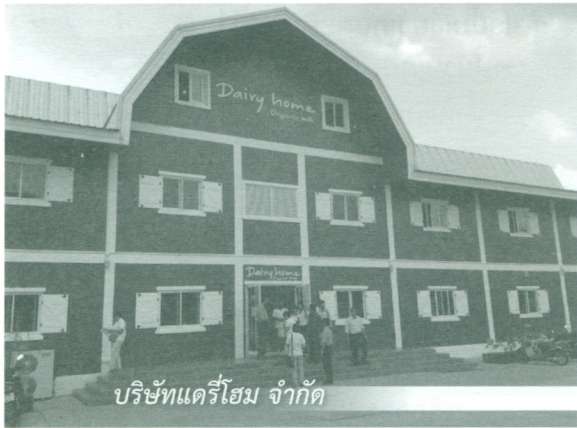
บริษัทแดรี่โฮม จำกัด