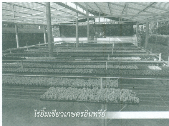
ไร่ยิ้มเขียวเกษตรอินทรีย์