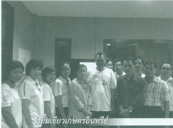
ไร่ยิ้มเขียวเกษตรอินทรีย์