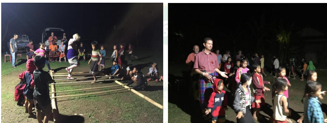
ภาพที่ 8 การแสดงศิลปะ

กลุ่มแสดงศิลปะมีสมาชิกทั้งหมด 21 คน ซึ่งเป็นลูกหลานของประชาชนบ้านนาตัวเอง มีหัวหน้ากลุ่ม 1 คน มีหน้าที่เป็นผู้ปกครองของเด็ก รวบรวมสมาชิก/นักแสดงอายุน้อยมาซ้อมและคิดค้นท่าฟ้อนรำต่าง ๆ ตามแบบฉบับที่เป็นเอกลักษณ์ของชนเผ่า จัดหาวัสดุอุปกรณ์การแสดง เช่น จัดหาเสื้อผ้า เครื่องแต่งกาย เพลง ทูน เป็นต้น