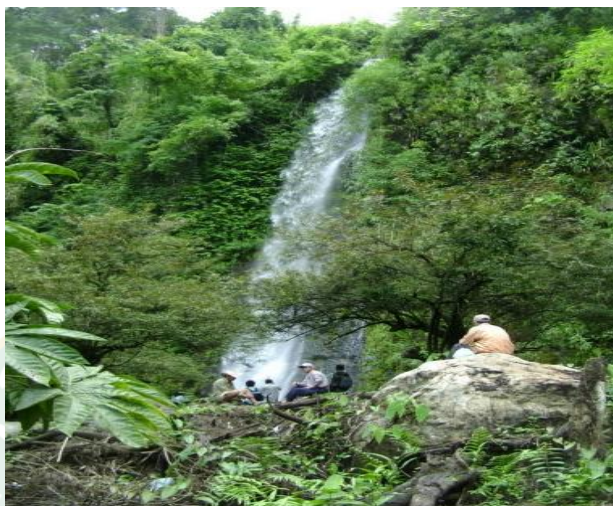
ภาพที่ 4 น้ำตกแก้งย้อย

บ้านนาด้วงยังมีหน้าที่และสิทธิในการดูแลรักษาสถานที่ท่องเที่ยวที่น้ำตกแก้งย้อยให้มีความยั่งยืน ไว้ให้ลูกหลานในอนาคตได้มีส่วนร่วมในการใช้และเก็บเกี่ยวผลประโยชน์ต่อ ๆ กันไป ดังภาพที่ 4