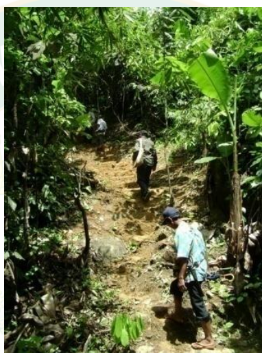
ภาพที่ 9 การเดินป่า

การเดินป่าเป็นอีกกิจกรรมการท่องเที่ยวแบบผจญภัยประเภทหนึ่ง นอกจากจะให้ความเพลิดเพลินแล้ว ยังให้ประสบการณ์และความรู้เกี่ยวกับชีวนาพันธุ์ และสิ่งมีชีวิตในป่า ได้สัมผัสกับธรรมชาติ ได้เห็นความอุดมสมบูรณ์ของป่าไม้ ห้วยและลำธาร บ้านนาด้วงเต็มไปด้วยภูเขา ผา ป่าไม้ ลำห้วยที่ไหลเซาะมาจากน้ำแก่งย้อย ดังนั้น จึงทำให้กิจกรรมการท่องเที่ยวแบบเดินป่าเกิดขึ้น เป็นอีกทางเลือกหนึ่งที่เหมาะสมสำหรับพื้นที่แห่งนี้ ดังภาพที่ 9