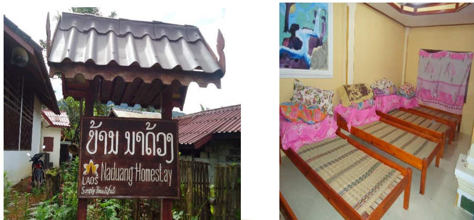
ภาพที่ 5 ที่พักแบบสัมผัสวัฒนธรรมชนบท

กลุ่มบริการที่พักแบบสัมผัสวัฒนธรรมชนบท นอกจากจะมีหน้าที่ในการจัดเตรียมสถานที่พักแล้ว ยังมีหน้าที่พาแขกหรือนักท่องเที่ยวเข้าพักตามสถานที่ที่ได้จัดเตรียมไว้ตามลำดับที่ได้ตกลงกันไว้ภายในกลุ่ม นอกจากนี้ยังมีหน้าที่ติดตาม และอำนวยความสะดวกให้กับแขกที่เข้ามาพักแม้ว่าแขกจะมาพักที่บ้านของตนหรือไม่ก็ตาม เพื่อดูแลเรื่องความปลอดภัยให้กับแขก สมาชิกทุกคนภายในครัวเรือนก็ยังมีหน้าที่ในการถ่ายทอดประสบการณ์เกี่ยวกับวิถีการดำรงชีวิต วัฒนธรรม ประเพณี รวมถึงการให้แขกสามารถมีส่วนร่วมในกิจกรรมประจำวันของครอบครัว ไม่ว่าจะเป็นการทำอาหาร การหาปูหาปลา การทำไร่ทำนา และกิจกรรมอื่น ๆ เพื่อให้แขกได้เก็บเกี่ยวประสบการณ์จากการที่ได้มาพักกับเรา ในขณะเดียวกัน เจ้าของบ้านหรือสมาชิกภายในบ้านก็ได้เรียนรู้วัฒนธรรมและแลกเปลี่ยนประสบการณ์กับแขกจากการที่ได้พูดคุยและทำกิจกรรมร่วมกัน