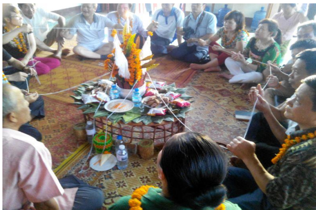
ภาพที่ 7 พิธีบายศรีสู่ขวัญ

การทอเถียวบ้านนาด้วงก็ได้นำเอากิจกรรมที่เป็นเอกลักษณ์ทางวัฒนธรรมดังกล่าวเข้ามาเป็นอีกกิจกรรมหนึ่งเพื่อดึงดูดนักท่องเที่ยว และสร้างความประทับใจให้กับนักท่องเที่ยว ซึ่งกลุ่มบายศรีสู่ขวัญมีสมาชิกทั้งหมด 6 คน เป็นเพศหญิง 2 คน เพศชาย 4 คน ประกอบด้วยหัวหน้ากลุ่ม 1 คน มีหน้าที่ในการระดมสมาชิกภายในกลุ่มให้ปฏิบัติหน้าที่ของแต่ละคนอย่างเต็มที่ รองหัวหน้ากลุ่ม 1 คน มีหน้าที่เป็นผู้ช่วยหัวหน้ากลุ่มวางแผน และทำงานแทนหัวหน้ากลุ่มในกรณีหัวหน้ากลุ่มติดภารกิจอื่น นอกจากหัวหน้ากลุ่มแล้วยังมีหมอปพร (ผู้ทำพิธี) 1 คน ผู้จัดเตรียมวัสดุอุปกรณ์ต่าง ๆ 2 คน และผู้ประสานงาน 1 คน ซึ่งมีหน้าที่เป็นผู้แจ้งให้แขก หรือนักท่องเที่ยวที่มาพักว่าจะมีการบายศรีสู่ขวัญในวัน เวลา และสถานที่ใด นอกจากนั้นผู้ประสานงานยังมีหน้าที่ประสานงานกับผู้เฒ่าผู้แก่ภายในบ้านที่มีประสบการณ์ในการทำพิธีบายศรีสู่ขวัญมาช่วยโดยเฉพาะในกรณีมีนักท่องเที่ยวมาเป็นคณะทัวร์เยอะ ๆ