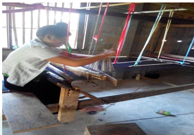
ภาพที่ 6 การทอผ้า

แล้ว นักท่องเที่ยวบางคนหรือบางกลุ่มยังสนใจในการเรียนรู้วิธีทอผ้ากับชาวบ้านโดยเฉพาะ นักท่องเที่ยวที่มาพักแบบสัมผัสวัฒนธรรมชนบท