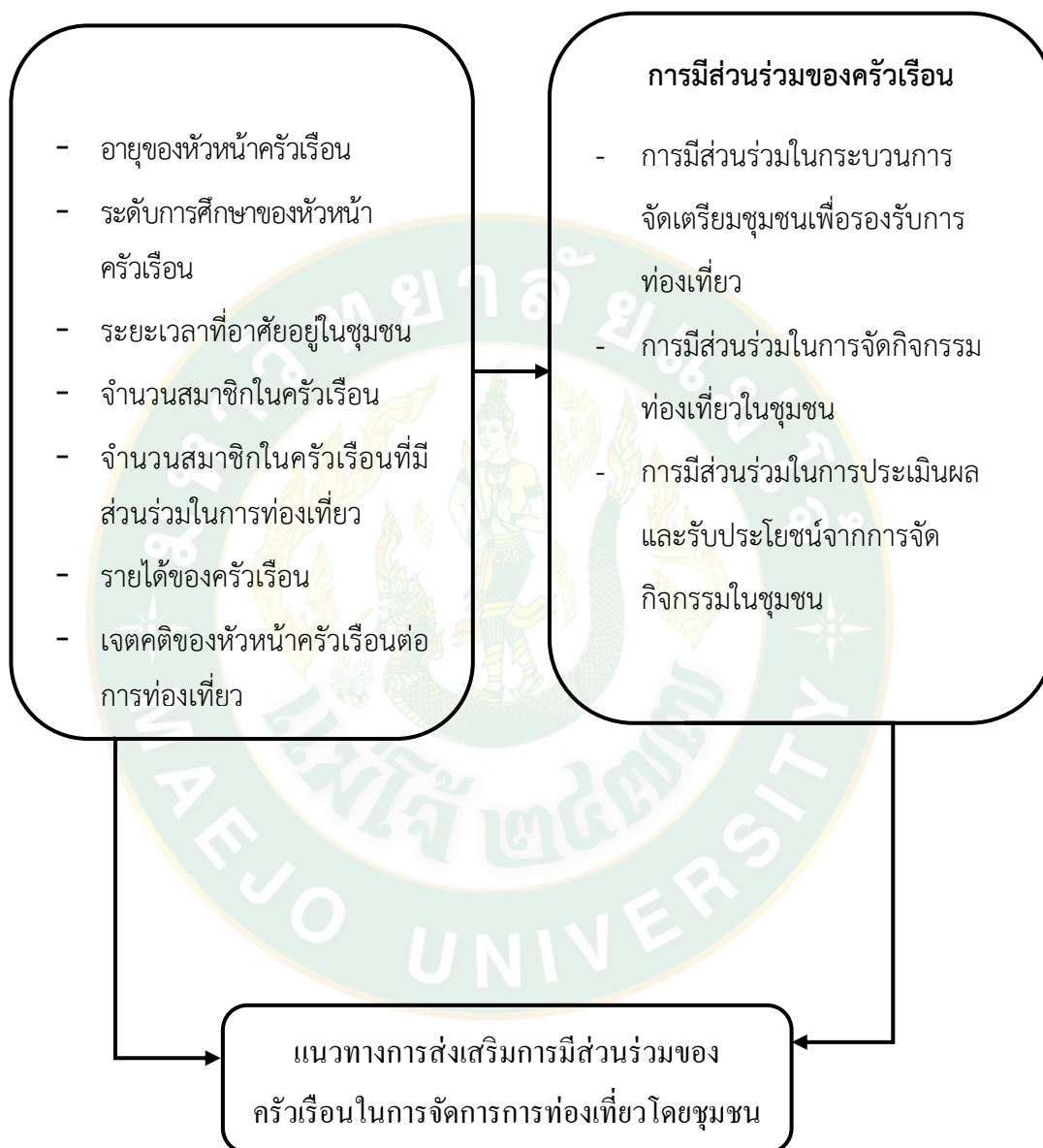
ภาพที่ 2 กรอบแนวคิดการวิจัย