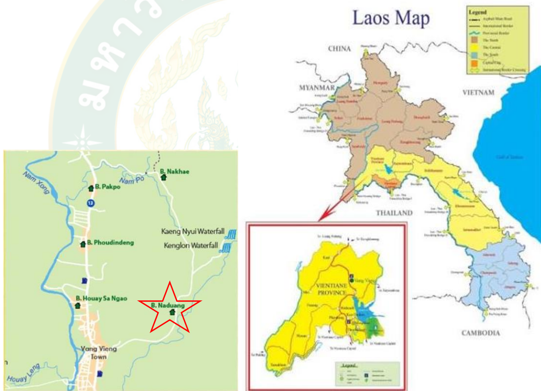
ภาพที่ 3 แผนที่ สปป. ลาว และแผนที่แขวงเวียงจันทน์

การเข้าถึงบ้านนาด้วง สามารถเดินทางโดยรถยนต์ส่วนตัว หรือรถจักรยานยนต์ หากออกจากตัวเมืองวังเวียงถึงบ้านนาด้วง มีระยะทาง 6 กิโลเมตร ไปทางทิศตะวันออก ใช้เวลาประมาณ 10 นาที