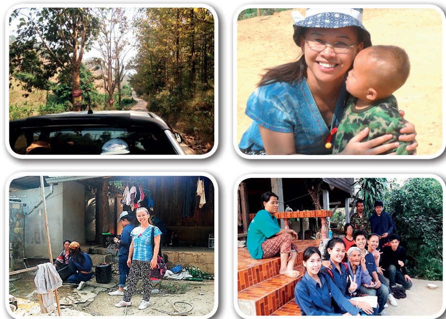
ภาพที่ 6 ประสบการณ์การเรียนรู้วิถีชีวิตและความสัมพันธ์กับชุมชน