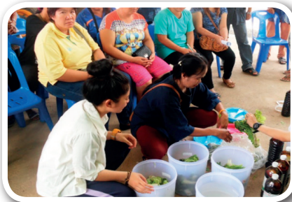
ภาพที่ 7 กิจกรรมทำน้ำหมักชีวภาพจากขยะในครัวเรือน และปุ๋ยหมักจากขยะอินทรีย์ในครัวเรือนและวัสดุเหลือใช้จากพื้นที่การเกษตร