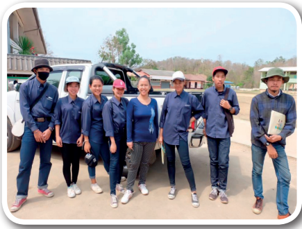
ภาพที่ 3 คณะสำรวจพื้นที่ตำบลห้วยโรง

กิจกรรมการสำรวจ ครั้วเรือนตัวอย่างจำนวน 202 ครั้วเรือน เพื่อนำข้อมูลที่ได้มา กำหนดรูปแบบการจัดการขยะที่เหมาะสมกับประเภทและปริมาณขยะ พฤติกรรม และทัศนคติ ของประชาชนด้านการจัดการขยะทั้งในครั้วเรือนและพื้นที่การเกษตร อันจะนำไปสู่ความร่วมมือ ในการปฏิบัติอย่างต่อเนื่องด้วยชุมชนเองในอนาคต เพื่อให้ขยะในครั้วเรือนและในพื้นที่การเกษตร ซึ่งถือเป็นต้นทางของปัญหาขยะนั้นลดลง และในขณะเดียวกันสามารถสร้างอรรถประโยชน์ ให้กับชุมชนได้อีกด้วย