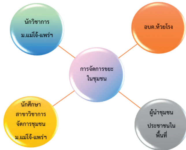
ภาพที่ 2 พหุภาคีการพัฒนา

โครงการพัฒนาดังกล่าว ประกอบด้วย 2 โครงการย่อย (Sub-project) ได้แก่ 1) โครงการตำบลต้นแบบการจัดการขยะและของเหลือใช้อย่างครบวงจร และ 2) โครงการวิจัยเพื่อประเมินผลการดำเนินโครงการ ซึ่งบทความเรื่องนี้จะนำเสนอผลการดำเนินงานของโครงการย่อยที่ 1 เพื่อสะท้อนให้เห็นการดำเนินการ