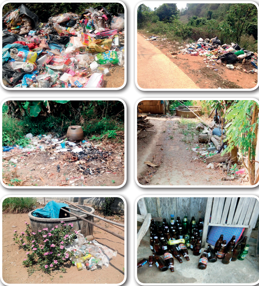
ภาพที่ 4 ขยะที่สำรวจพบในพื้นที่

ทำกิจกรรม เป็นส่วนหนึ่งที่ทำให้คนในชุมชนโดยเฉพาะหมู่บ้านที่ห่างไกลที่เคยมีความรู้สึก แตกต่าง เกิดสัมพันธ์ไมตรีที่ดีต่อองค์กรปกครองส่วนท้องถิ่น คณะผู้ดำเนินโครงการ ผู้นำ และตัวแทนชุมชนมากขึ้น (ภาพที่ 6)