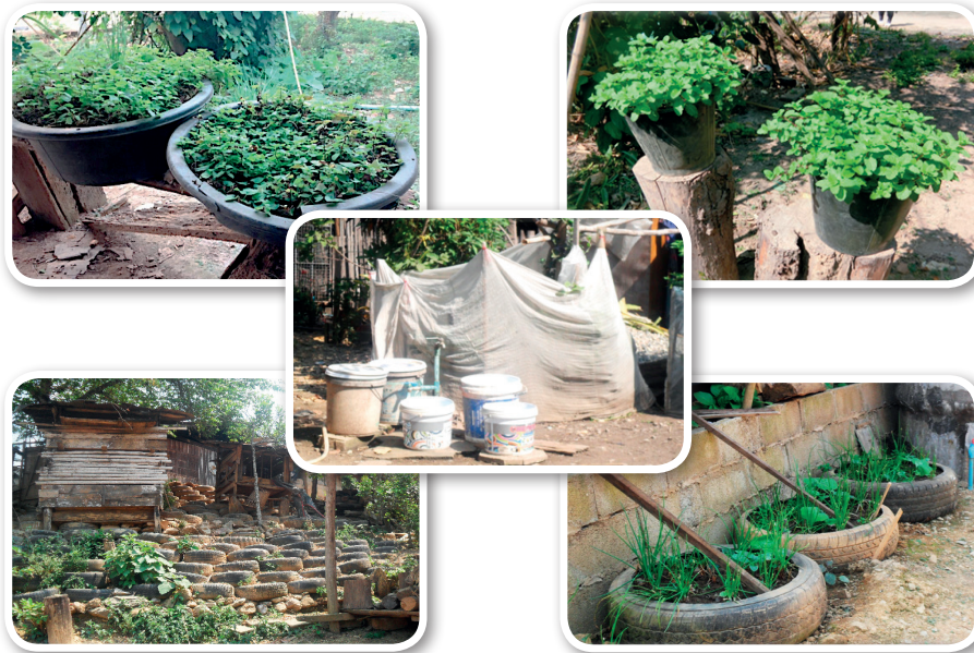
ภาพที่ 5 การใช้ประโยชน์จากของเหลือใช้ในครัวเรือนของชุมชน

กลุ่มที่ 2 เด็กและเยาวชนตำบลห้วยโรง เป็นการอบรมให้ความรู้ด้านปัญหา ทักษะ การจัดการขยะ และการฝึกปฏิบัติการแปรรูปขยะทั่วไปเพื่อเป็นของใช้ในครัวเรือน และสร้างมูลค่า ได้ในอนาคต