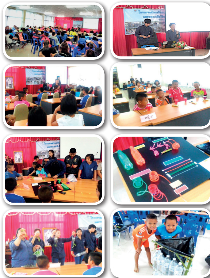
ภาพที่ 8 กิจกรรมอบรมเชิงปฏิบัติการการคัดแยกขยะและการจัดการ เพื่อสร้างอรรถประโยชน์สำหรับเด็กและเยาวชนตำบลห้วยโรง

บทเรียนที่ได้จากหลักสูตรที่ 2 นอกจากการนำวัสดุเหลือใช้และขยะที่ไม่มีมูลค่ามาใช้ให้เกิดประโยชน์ในครัวเรือนได้แล้วนั้น ยังเป็นการพัฒนาทักษะและความรู้ของนักศึกษาสาขาการจัดการชุมชน ในการฝึกวิเคราะห์ วางแผนและบริหารโครงการ การพัฒนาวัสดุอุปกรณ์ที่เหมาะสมกับกลุ่มเป้าหมาย ปัญหาและสภาพพื้นที่ ตลอดจนได้ฝึกทักษะการเป็นวิทยากรบรรยาย วิทยากรกระบวนการ และมีโอกาสเชื่อมความสัมพันธ์ที่ดีกับ อบต.ห้วยโรง ผู้นำชุมชน ประชาชน กลุ่มเด็กและเยาวชนในพื้นที่ ทำให้คนในชุมชนได้รู้จักมหาวิทยาลัยแม่โจ้มากยิ่งขึ้น