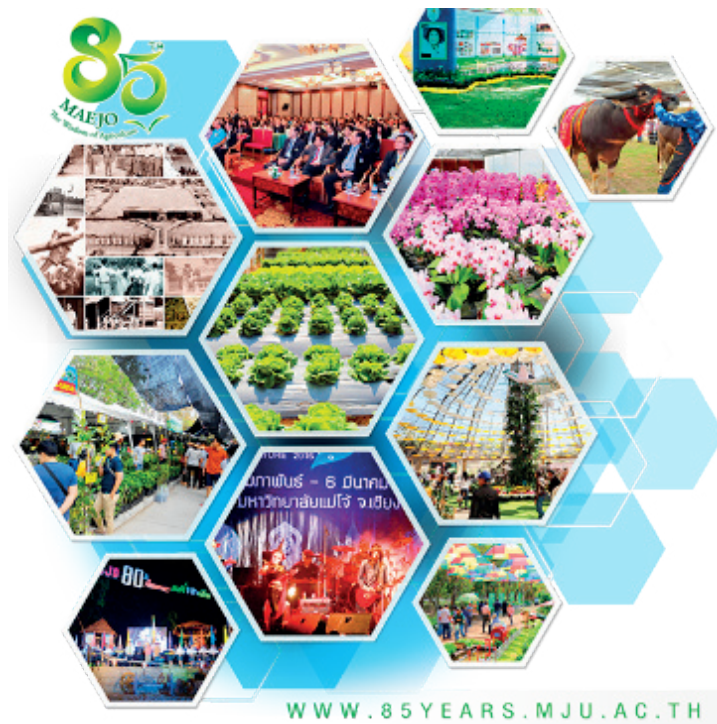
ภาพที่ 3 ภาพประชาสัมพันธ์งานวันเกษตรแม่โจ้ 85 ปี