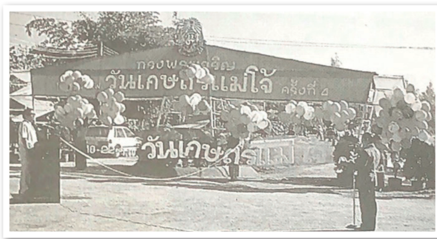
ภาพที่ 2 งานวันเกษตรมแม่ใจครั้งที่ 4 วันที่ 19 กุมภาพันธ์ 2527