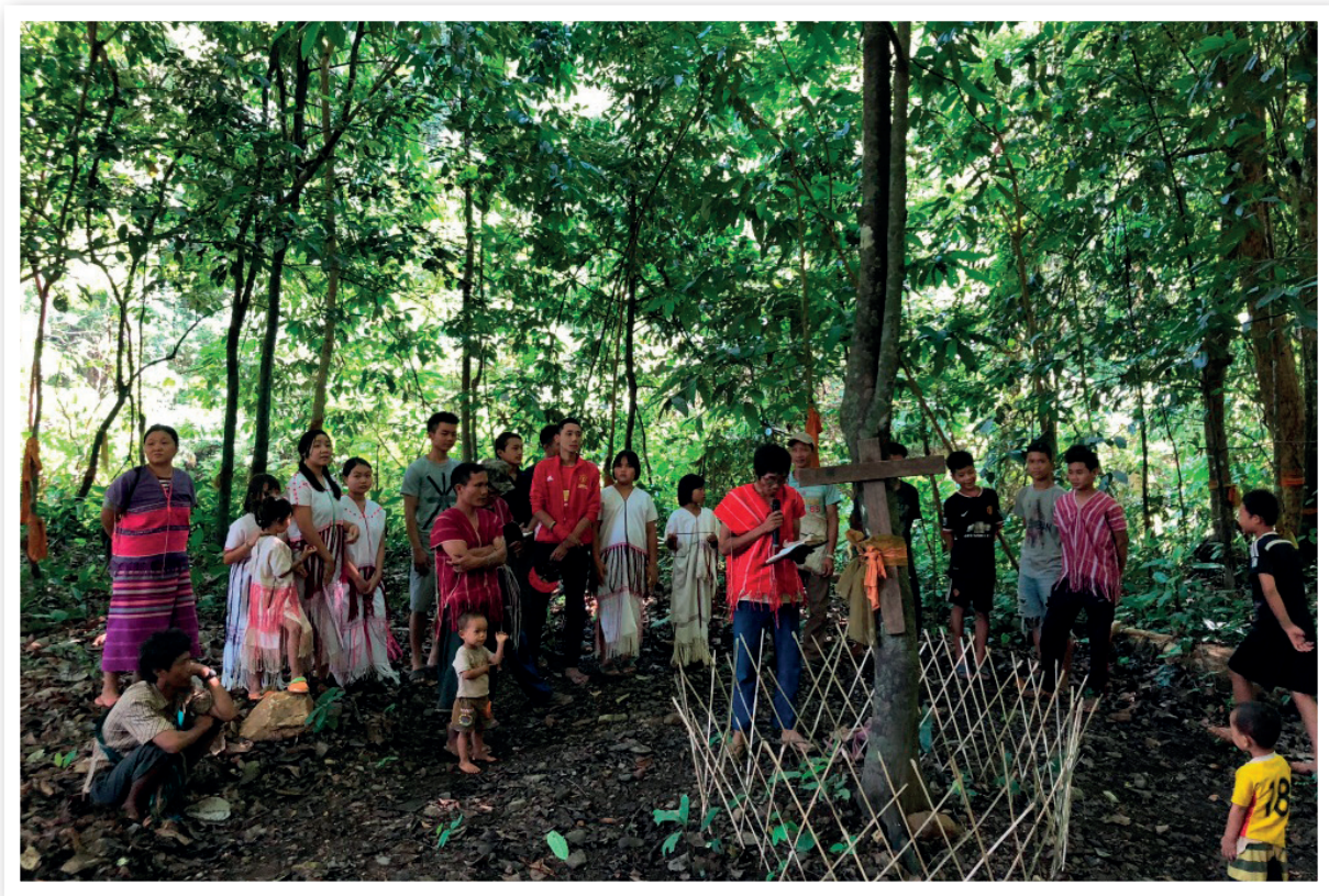
ภาพที่ 12 พิธีกรรมศาสนาคริสต์

หลังจากขั้นตอนพิธีกรรมที่ได้กล่าวมาแล้ว ชาวบ้านและผู้ร่วมงานจึงร่วมกันนำผ้าเหลืองหรือกาสาพัสตร์ ซึ่งเป็นสัญลักษณ์ของความเป็นภิกษุสามเณรในพระพุทธศาสนาที่เตรียมไว้พันรอบต้นไม้ในบริเวณพิธี เพื่อเป็นสัญลักษณ์แสดงการปกป้องคุ้มครองป่าต้นน้ำ