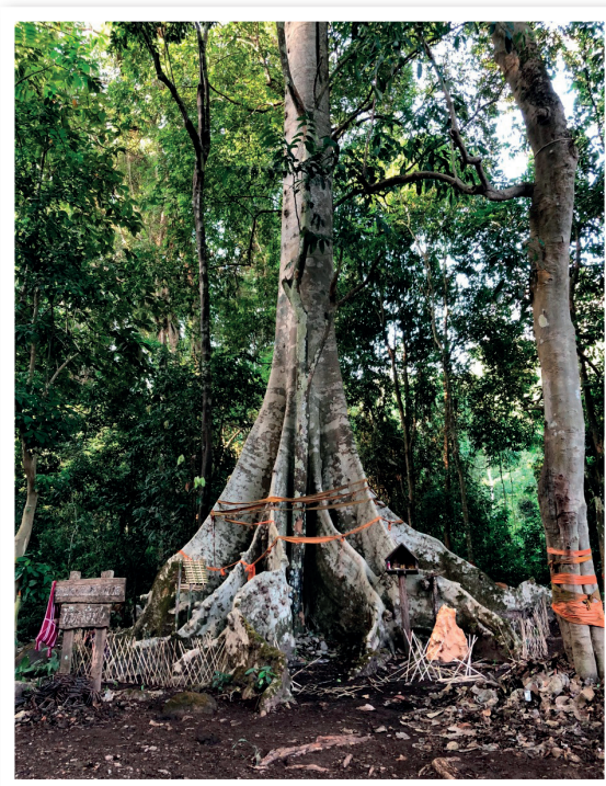
ภาพที่ 4 จัดพิธีกรรมบริเวณต้นไม้ใหญ่ของหมู่บ้าน

กิจกรรมดังกล่าวจัดขึ้นเพื่อให้ชาวบ้านตระหนักถึงความสำคัญของการอนุรักษ์ป่าต้นน้ำ และร่วมกันกำหนดบทลงโทษและกติกาในการดูแลป่าต้นน้ำ โดยในปี พ.ศ. 2561 นี้ ดำเนินการต่อเนื่องมาเป็นครั้งที่ 5 มีผู้เข้าร่วมกิจกรรมประกอบไปด้วยชาวบ้านและเยาวชนในชุมชน องค์กรพัฒนาเอกชน ตัวแทนจากหน่วยงานราชการที่เกี่ยวข้อง ประมาณ 100 คน