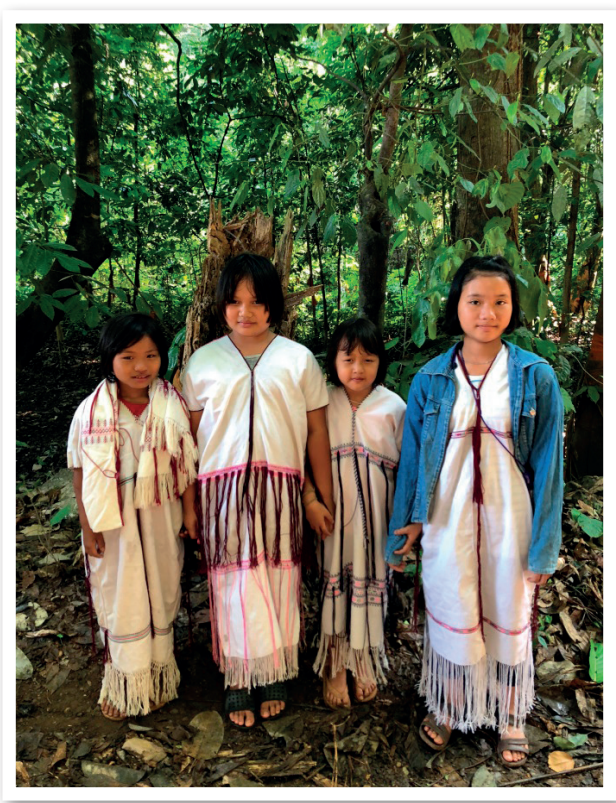
ภาพที่ 7 เด็กหญิงจากกลุ่มหมู่บ้านแพรกละวินสวมชุดปกากะญอเข้าร่วมกิจกรรม

สิ่งที่น่าสนใจคือ กิจกรรมดังกล่าวมีการผสมผสานพิธีกรรมตามความเชื่อของคนในหมู่บ้าน ทั้งผี พุทธ และคริสต์ โดยบริเวณที่ประกอบพิธีคือใต้ต้นไม้ใหญ่ที่สุดในหมู่บ้าน (ต้นเน)