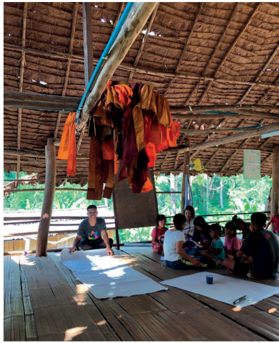
ภาพที่ 3 เยาวชนหมู่บ้านแพรกสาละวินร่วมกันเตรียมงานบวชป่าต้นน้ำ

กิจกรรมดังกล่าวจัดขึ้นเพื่อให้ชาวบ้านตระหนักถึงความสำคัญของการอนุรักษ์ป่าต้นน้ำ และร่วมกันกำหนดบทลงโทษและกติกาในการดูแลป่าต้นน้ำ โดยในปี พ.ศ. 2561 นี้ ดำเนินการต่อเนื่องมาเป็นครั้งที่ 5 มีผู้เข้าร่วมกิจกรรมประกอบไปด้วยชาวบ้านและเยาวชนในชุมชน องค์กรพัฒนาเอกชน ตัวแทนจากหน่วยงานราชการที่เกี่ยวข้อง ประมาณ 100 คน