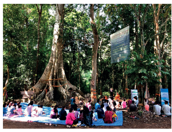
ภาพที่ 6 ผู้เข้าร่วมกิจกรรม