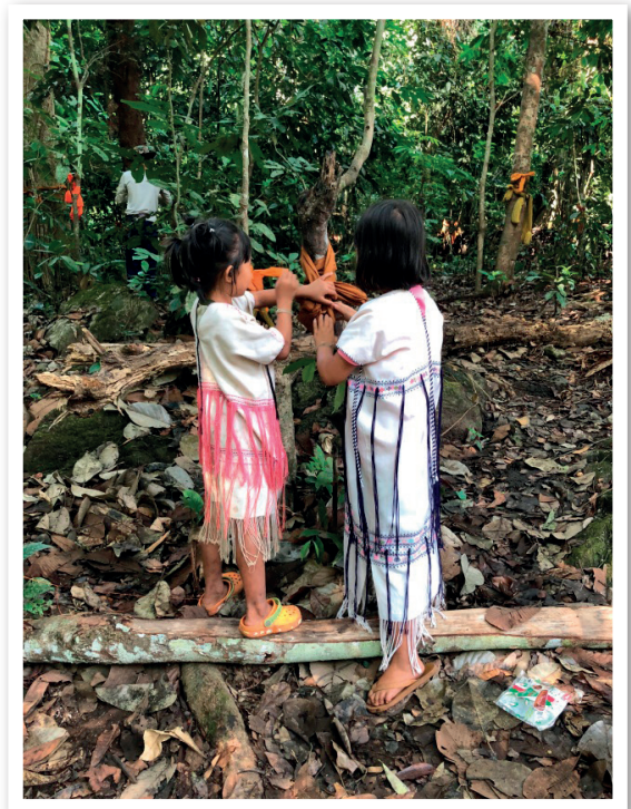
ภาพที่ 13 และ 14 ชาวบ้านและเยาวชนร่วมกันบวชป่า