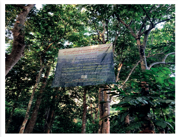
ภาพที่ 5 บทลงโทษและกติกาในการดูแลป่าต้นน้ำ