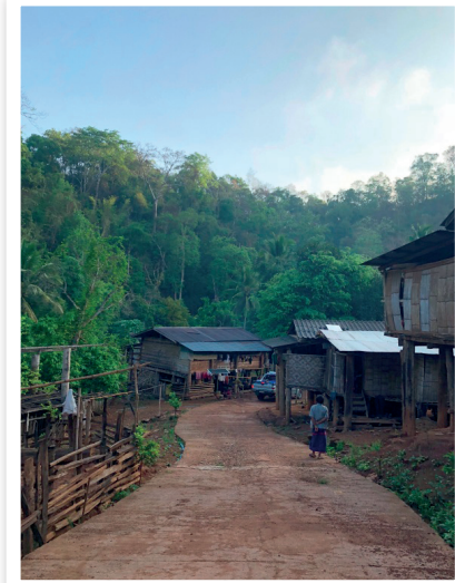
ภาพที่ 1 และ 2 ทางเข้าหมู่บ้านแม่ลามาน้อยและสภาพบ้านเรือน

มูลเหตุที่มีการจัดกิจกรรมบวชป่าต้นน้ำขึ้นครั้งแรก เมื่อปี พ.ศ. 2557 เนื่องจากชาวบ้านในชุมชน และกลุ่มหมู่บ้านแพรกสาละวิน (องค์กรสาธารณประโยชน์ทะเบียนเลขที่ 3735) ซึ่งเป็นกลุ่มเยาวชนจิตอาสา ของชุมชนที่รวมตัวกันจัดตั้งกลุ่มฯ เพื่อเรียนรู้และสืบทอดภูมิปัญญา “อาหาร ยา ผ้า บ้าน” พบว่าพื้นที่ป่าต้นน้ำ ถูกบุกรุกมากขึ้น รวมทั้งมีการล่าสัตว์ป่าเป็นอาหารแต่ขาดการจัดการดูแลให้เกิดแหล่งขยายพันธุ์หรืออนุรักษ์ พันธุ์สัตว์ป่าจึงทำให้สัตว์ป่าลดลง ส่งผลต่อเนื่องให้แหล่งอาหารตามธรรมชาติของชุมชนลดลง กระทบ ต่อความเป็นอยู่ของชุมชน จึงได้ร่วมกันจัดกิจกรรมบวชป่าต้นน้ำ โดยครอบคลุมพื้นที่ป่าต้นน้ำบ้านแม่ลามาน้อย ประมาณ 10,000 ไร่ และเขตรักษาพันธุ์สัตว์น้ำ บ้านแม่ลามาน้อย 870 เมตร