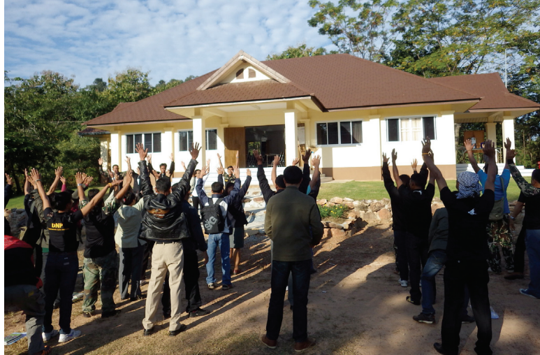
ภาพที่ 3 กิจกรรมการละลายพฤติกรรม ณ โครงการท่องเที่ยวเชิงนิเวศภูฝอยลม อำเภอหนองแสง จังหวัดอุดรธานี

ในการฝึกอบรมครั้งนี้ที่มหาวิทยาลัยได้บรรยายให้ความรู้ แลกเปลี่ยนประสบการณ์ต่าง ๆ และเปิดโอกาสให้ผู้เข้ารับการฝึกอบรมได้มีส่วนร่วมในกิจกรรมต่าง ๆ ทบทวนบทบาทหน้าที่ และพัฒนาบุคลิกภาพความเป็นผู้ประสานงานชุมชนด้านป่าไม้ที่ดี เพื่อเพิ่มพูนทักษะและเทคนิคการทำงานในการสร้างจิตสำนึก และการทำงานร่วมกับชุมชน เสริมสร้างศักยภาพให้กับเจ้าหน้าที่ประสานงานชุมชน เพื่อเตรียมความพร้อมที่จะปฏิบัติงานในกิจกรรมเครือข่ายชุมชนต้นน้ำ มีการเปิดโอกาสให้มีการแลกเปลี่ยนเรียนรู้ ความรู้ ทักษะ และประสบการณ์ระหว่างกัน ซึ่งเป็นประโยชน์อย่างมากต่อการปฏิบัติงานเครือข่ายชุมชนต้นน้ำให้มีประสิทธิภาพและเกิดประสิทธิผลต่อไป โดยหลักสูตรมีเนื้อหาที่เข้มข้นมากตลอดระยะเวลา 3 วันที่ทำการฝึกอบรม หัวข้อที่ต้องให้ความรู้ คือ