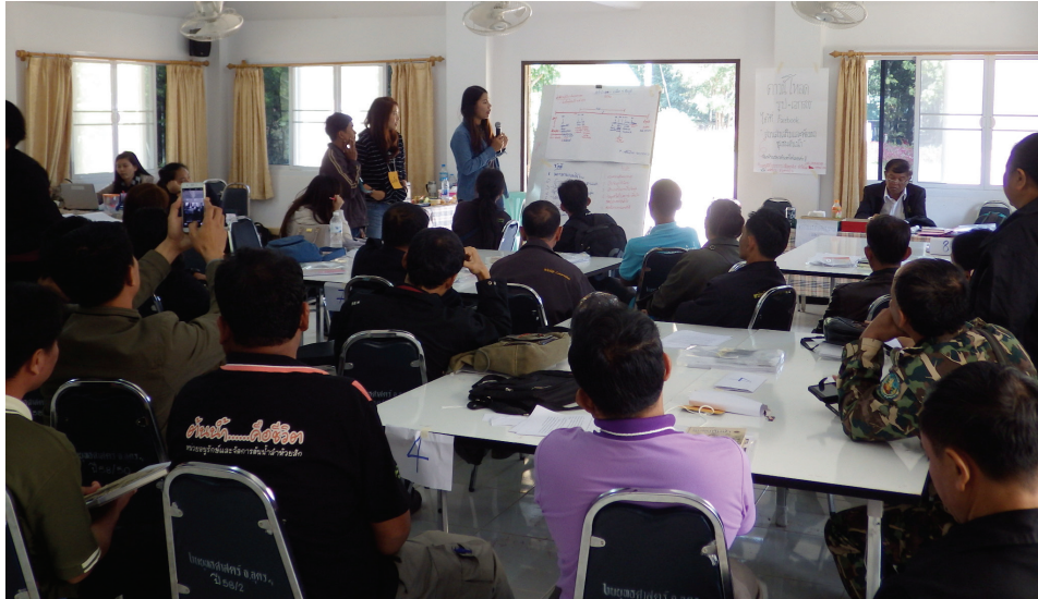
ภาพที่ 8 การฝึกเทคนิคการใช้เครื่องมือประเภทต่าง ๆ