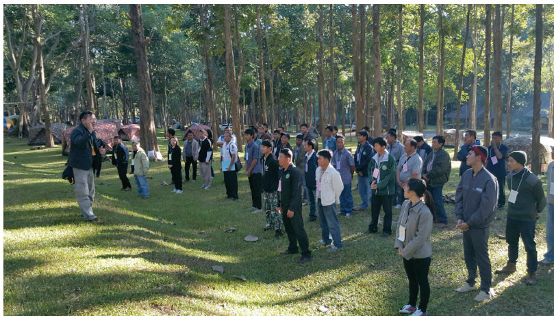
ภาพที่ 5 การบรรยายนอกห้องเรียน และแบ่งให้ทำกิจกรรมกลุ่ม ณ อุทยานแห่งชาติแจ้ซ้อน อำเภอเมืองปาน จังหวัดลำปาง

5. เทคนิคการเป็นผู้อำนวยความสะดวก (Facilitator) เพื่อให้ผู้เข้ารับการฝึกอบรมได้เรียนรู้และนำเทคนิคการเป็นผู้อำนวยความสะดวกมาฝึกปฏิบัติ เพื่อจะได้นำไปประยุกต์ใช้ได้อย่างถูกต้อง นำทีมโดย อาจารย์ปณิธิ บุญสา