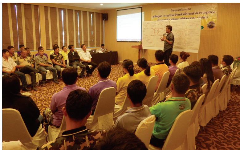
ภาพที่ 2 กิจกรรมแลกเปลี่ยนเรียนรู้การบริหารจัดการลุ่มน้ำแบบบูรณาการ และองค์กรเครือข่ายลุ่มน้ำ ณ โรงแรมดิอิมเพลส จังหวัดน่าน

งานบริการวิชาการที่ทางทีมคณาจารย์จากมหาวิทยาลัยแม่โจ้-แพร่ เฉลิมพระเกียรติ ได้มีโอกาส นำความรู้สู่สังคม โดยรับเชิญเป็นวิทยากรจากกรมอุทยานแห่งชาติ สัตว์ป่า และพันธุ์พืช ในการจัดฝึกอบรมแก่ข้าราชการ พนักงานราชการ และพนักงานจ้างเหมาเอกชน ในหลักสูตร “การเป็นเจ้าหน้าที่ประสานงานชุมชนด้านการส่งเสริมการมีส่วนร่วม (จปส.)” เนื่องจากเจ้าหน้าที่ประสานงานชุมชน เป็นผู้ทำงานใกล้ชิดกับชุมชนที่สุด มีบทบาทเป็นผู้ประสานงานระหว่างชุมชนกับหน่วยงาน องค์กรภาครัฐ ภาคเอกชน และต้องได้รับความไว้วางใจจากชาวบ้านจึงจะได้รับความร่วมมือที่ดีในการปฏิบัติงาน ซึ่งมีผลต่อความสำเร็จในการดำเนินงานโครงการต่าง ๆ ขององค์กร สำนักอนุรักษ์และจัดการต้นน้ำ โดยหน่วยงานสนามด้านการอนุรักษ์และจัดการต้นน้ำ มีเจ้าหน้าที่ประสานงานชุมชนที่ปฏิบัติหน้าที่ในงานด้านการส่งเสริมการมีส่วนร่วมของชุมชนที่เป็นกำลังสำคัญในพื้นที่ แต่เจ้าหน้าที่ประสานงานชุมชนเหล่านี้ยังต้องการเทคนิค กระบวนการฝึกอบรมทบทวนความรู้ และเสริมสร้างทักษะใหม่ ๆ ดังนั้น การจัดฝึกอบรมในหลักสูตรนี้จึงเป็นการเสริมสร้างศักยภาพในการทำงานของเจ้าหน้าที่ และเตรียมความพร้อมในการปฏิบัติงานภายใต้กิจกรรมเครือข่ายชุมชนต้นน้ำ ให้มีความพร้อมในการทำงานอย่างเต็มความสามารถ