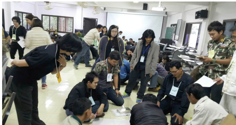
ภาพที่ 4 กิจกรรมกลุ่มการบริหารจัดการลุ่มน้ำแบบบูรณาการ และองค์กรเครือข่ายลุ่มน้ำ ณ โครงการท่องเที่ยวเชิงนิเวศภูฝอยลม อำเภอหนองแสง จังหวัดอุดรธานี

ในการฝึกอบรมครั้งนี้ที่มหาวิทยาลัยได้บรรยายให้ความรู้ แลกเปลี่ยนประสบการณ์ต่าง ๆ และเปิดโอกาสให้ผู้เข้ารับการฝึกอบรมได้มีส่วนร่วมในกิจกรรมต่าง ๆ ทบทวนบทบาทหน้าที่ และพัฒนาบุคลิกภาพความเป็นผู้ประสานงานชุมชนด้านป่าไม้ที่ดี เพื่อเพิ่มพูนทักษะและเทคนิคการทำงานในการสร้างจิตสำนึก และการทำงานร่วมกับชุมชน เสริมสร้างศักยภาพให้กับเจ้าหน้าที่ประสานงานชุมชน เพื่อเตรียมความพร้อมที่จะปฏิบัติงานในกิจกรรมเครือข่ายชุมชนต้นน้ำ มีการเปิดโอกาสให้มีการแลกเปลี่ยนเรียนรู้ ความรู้ ทักษะ และประสบการณ์ระหว่างกัน ซึ่งเป็นประโยชน์อย่างมากต่อการปฏิบัติงานเครือข่ายชุมชนต้นน้ำให้มีประสิทธิภาพและเกิดประสิทธิผลต่อไป โดยหลักสูตรมีเนื้อหาที่เข้มข้นมากตลอดระยะเวลา 3 วันที่ทำการฝึกอบรม หัวข้อที่ต้องให้ความรู้ คือ