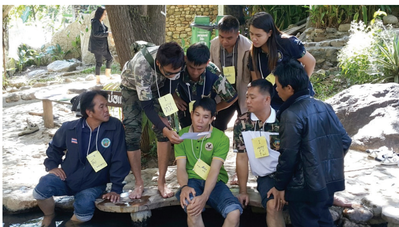
ภาพที่ 6 กิจกรรม Walk rally ทำงานร่วมกันเป็นทีม ณ อุทยานแห่งชาติแจ้ซ้อน อำเภอเมืองปาน จังหวัดลำปาง