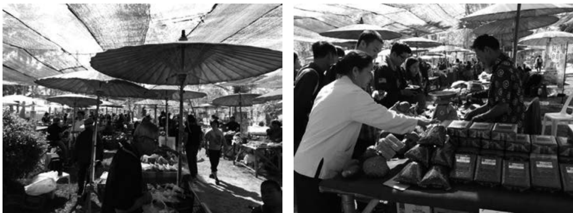
ภาพที่ 2 กาดนัดผลผลิตเกษตรกรเครือข่ายมหาวิทยาลัยแม่โจ้ ณ สนามวังซ้าย

ทั้งนี้ มหาวิทยาลัย จะได้ส่งเสริมเพื่อพัฒนาให้ชุมชนได้รับความรู้ เรื่อง “การผลิตเพื่อเป็นผลผลิตอินทรีย์” และติดตามสัญลักษณ์ซึ่งแสดงความปลอดภัยต่อไป