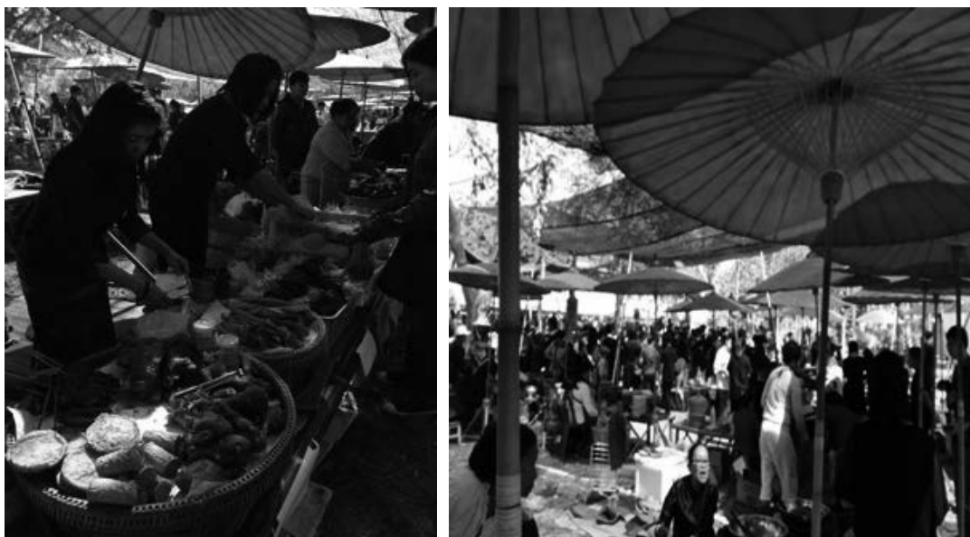
ภาพที่ 3 กาดหมั้ว ณ สนามวังซ้าย (ชุมชนและนักศึกษา) (ไซน ร่มสีแดง)

- กาดหมั้ว เป็นศูนย์การจำหน่ายอาหารจำนวน 40-45 ร้านค้า ที่มาจากชุมชนและนักศึกษา อาหารที่จำหน่ายมีทั้งประเภท อาหารคาวหวาน และเครื่องดื่ม แนวคิดการจัดกาดได้นำอัตลักษณ์ และวิถีชีวิตของชาวล้านนาที่ย้อนยุค มารังสรรค์ ด้วยวัฒนธรรมการบริโภคแบบล้านนา สืบสานและอนุรักษ์วิถีชีวิตของชุมชนที่อยู่รายรอบมหาวิทยาลัย โดยการบูรณาการอาหารพื้นบ้านที่หารับประทานได้ยากในสังคมเมือง ชาวบ้านชุมชนได้ร่วมกันนำอาหารที่อร่อย ปลอดภัย สร้างบรรยากาศการเลือกซื้ออาหาร ด้วยการแต่งกายพื้นเมือง อู่อ้าเมือง เหน็บดอกเอื้องผึ้ง และยังสืบสานวัฒนธรรมเกือกกุล สอนแนะให้นักศึกษา ได้มีโอกาสเรียนรู้จากเครือข่ายผู้อาวุโสในชุมชน เปิดโอกาสให้นักศึกษาโครงการปลูกผัก แลกค่าเทอม ได้นำผลผลิตมาทำการแปรรูปเป็นอาหารเครื่องดื่ม และของว่าง จำหน่ายเพื่อสร้างรายได้เพิ่มทักษะ การเป็นผู้ประกอบการเพื่อสังคม เพื่อสร้างงานและสร้างรายได้แก่ชุมชนด้วยวัฒนธรรมการบริโภคแบบล้านนา