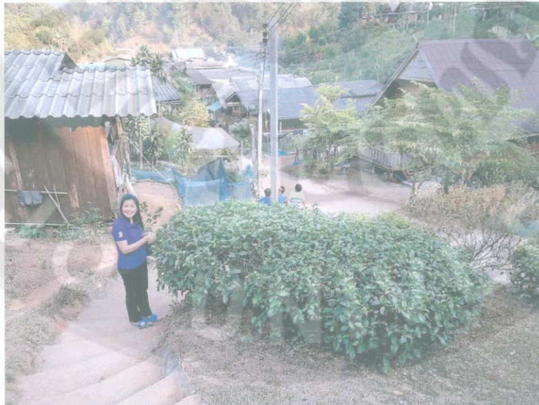
บรรยากาศบ้านห้วยน้ำกั้น