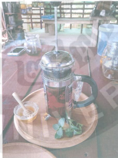
ร้านขายสินค้าให้นักท่องเที่ยว