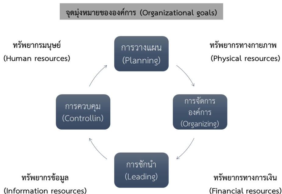
ภาพที่ 2 โครงสร้างความสัมพันธ์องค์การ