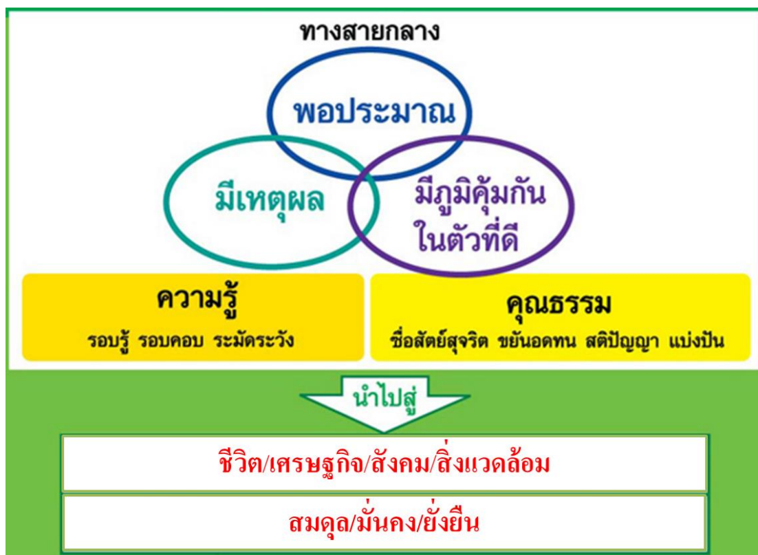
ภาพที่ 1 ปรัชญาของเศรษฐกิจพอเพียง

ความหมายของเศรษฐกิจพอเพียง (คณะอนุกรรมการเศรษฐกิจพอเพียง, 2547)